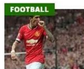
Di Maria inspires United rout of QPR