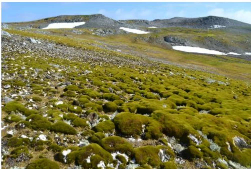
Hummocks of moss cover Ardley Island off the tip of the Antarctic Peninsula.