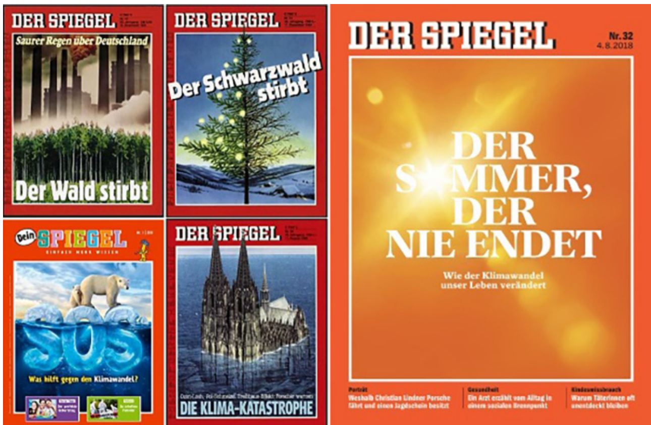
Unvollständige Auswahl von SPIEGEL Titeln mit Fakenews zur Panikmache.

1986 legte der Spiegel gleich mit zwei Untergangsfantasien nach: Nach dem Tod des Hollywoodstars Rock Hudson grassierte in deutschen Redaktionen das HIV – allerdings nur im Geist der Redakteure. Ansonsten blieb das wenig infektiöse Persistenzvirus auf die männliche Homosexuellenszene begrenzt, und auf einige sexuell Hyperaktive, wie im Dallas Buyer's Club Oscar-prämiert gezeigt. Zusätzlich war es das „Sturmgeschütz der Postdemokratie“, das im selben Jahr schon den Kölner Dom in den Fluten der Nordsee (oder des Mittelmeeres – so genau war man nicht) versinken sah. Hatte das Hanseatische Qualitätsmagazin in den 70er Jahren noch wie andere Zeitungen von der emissionsbedingten Eiszeit berichtet (die 70er waren kühl), schwenkte man jetzt auf die industrielle Heißzeit um (die 80er waren warm, paßte).