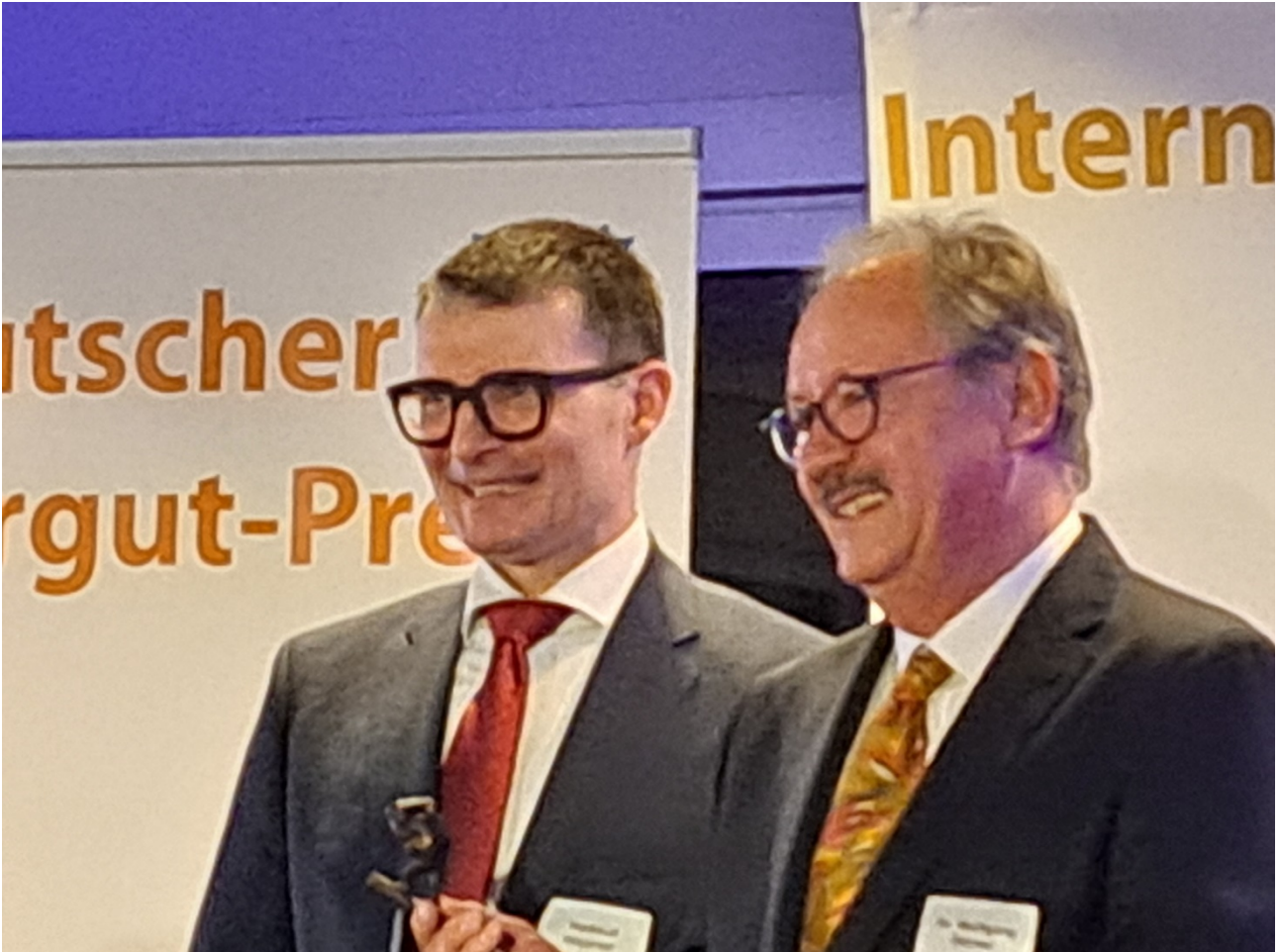
Abbildung 1 Staatssekretär im BMDV Hartmut Höppner (li)

Es war für mich beängstigend, nachdem ich anlässlich der Verleihung des Deutschen Gefahrgutpreises die Worte des Staatssekretärs Hartmut Höppner (BMDV) aufgenommen und versucht habe, sie zu verstehen. Es ging da um die Mobilität der Zukunft und vor allem um die Verwendung ‚neuer Kraftstoffe‘. Ich hatte aber akustisch nicht alles verstanden und das Bundesministerium für Digitales und Verkehr (BMDV) um Auskunft gebeten.