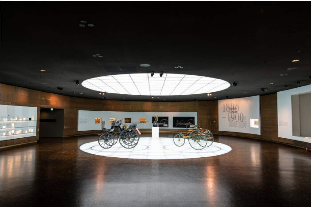
Abbildung 2 Die ersten funktionsfähigen Kraftfahrzeuge von Daimler und Benz wurden mit vor 140 Jahren mit Verbrennungsmotoren angetrieben (Ridder)

Schon lange vorher hatten die Politiker in Brüssel das Aus der Verbrennungsmotoren für 2035 beschließen wollen, doch es gelang dann Verkehrsminister Dr. Volker Wissing, das zu verhindern, wenn die Fahrzeuge mit e-Fuels gefahren werden.