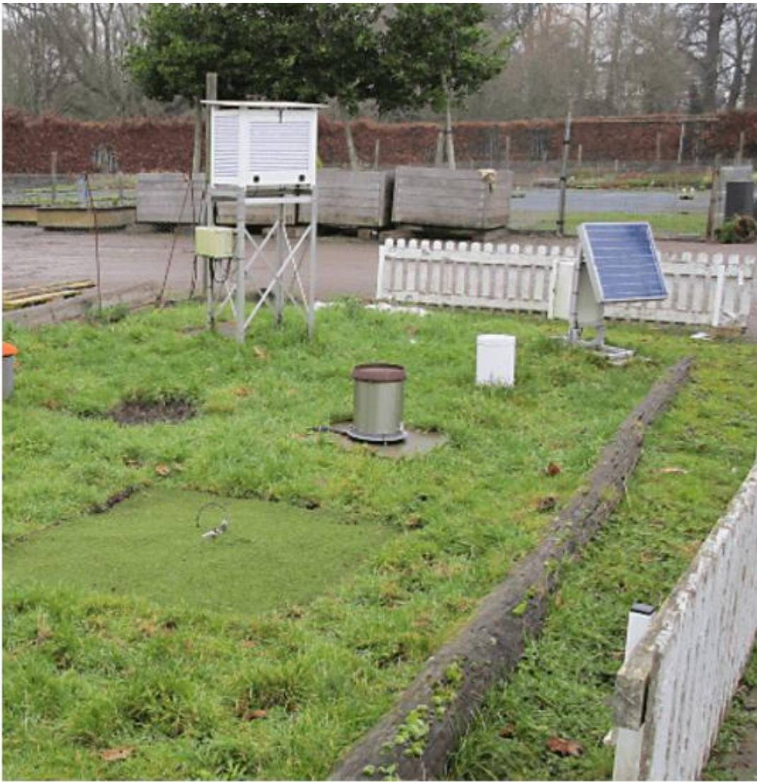
Bute Park - 1978