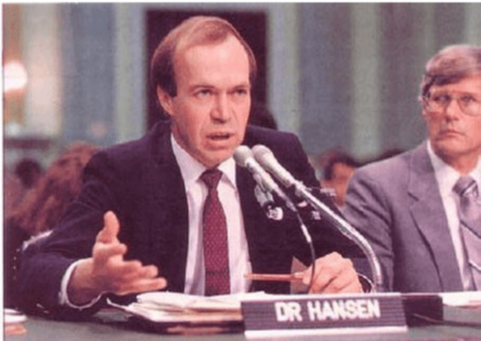
James Hansen, 1988 Senate Testimony

Im Juni 1988 hielt Senator Tim Wirth, damals Vorsitzender des Ausschusses für Energie und natürliche Ressourcen, die allererste Anhörung über die Wissenschaft des Klimawandels ab. Dr. James Hansen, Leiter eines Computermodellierungsteams bei der NASA, sagte aus , dass er „... zu 99 Prozent davon überzeugt ist, dass die Welt tatsächlich wärmer wird und dass dies mit hoher Wahrscheinlichkeit auf die vom Menschen verursachten Treibhausgase zurückzuführen ist.“