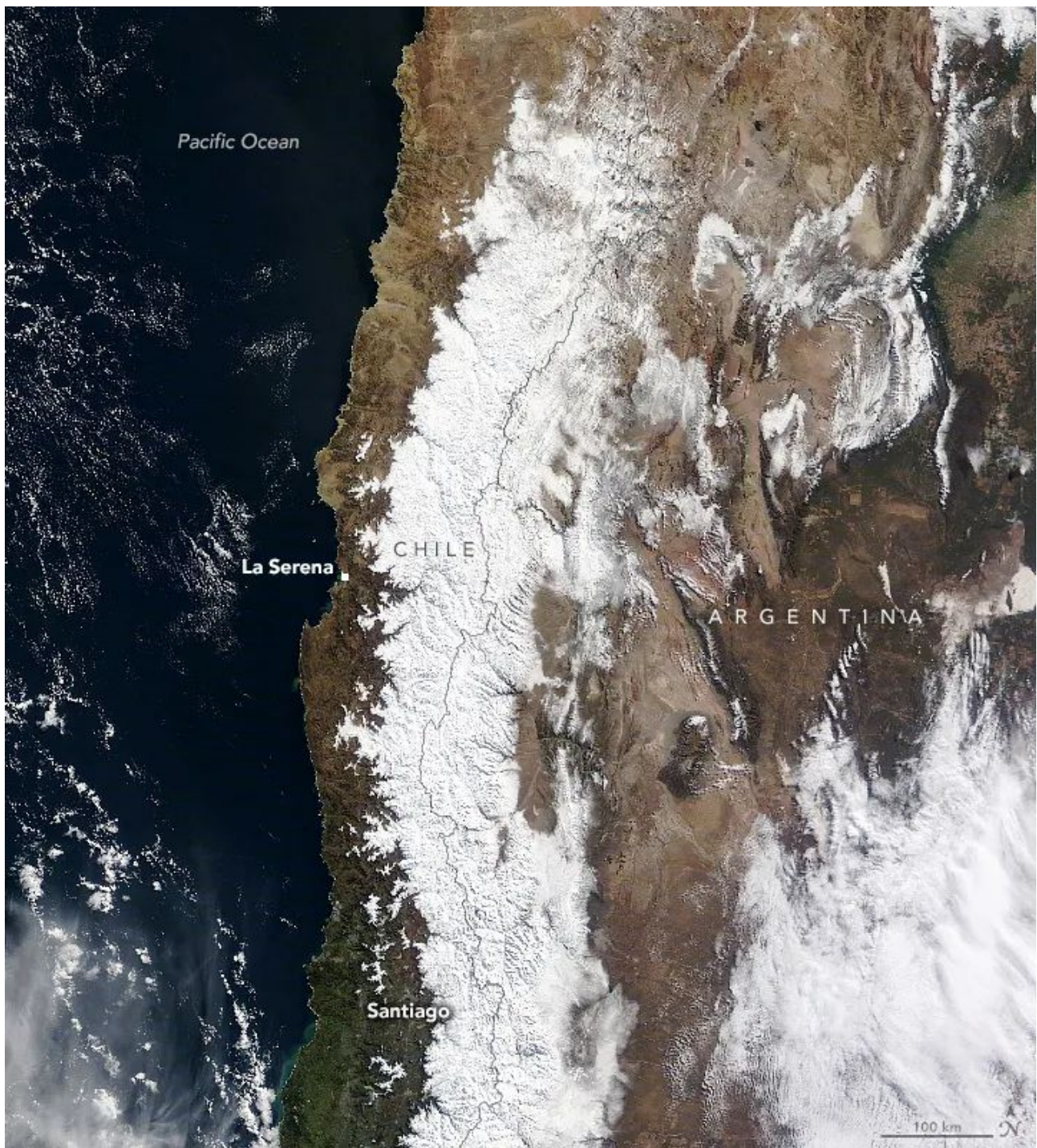
Schnee in den Anden am 16. Juli 2022.