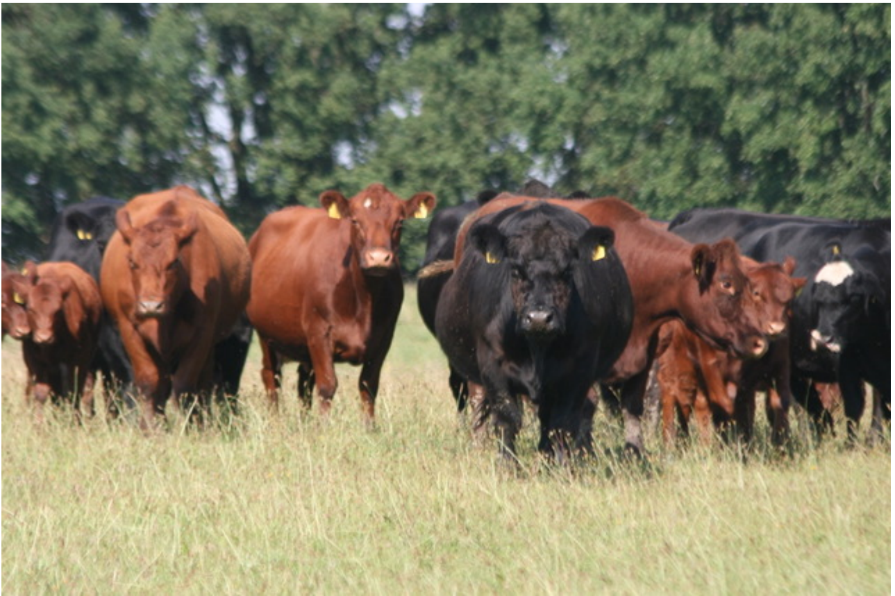
Rinderzucht ökologisch in Mecklenburg-Vorpommern. Das Fleisch ist gut und teuer