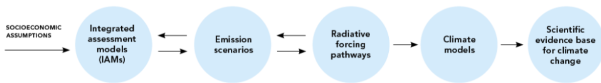
Figure 1. SCENARIO DEVELOPMENT PROCESS FLOW CHART

Die IPCC-Szenarien dienen den Bedürfnissen der Klimamodellierer, die hohe technische Anforderungen an die Eingangsparameter für ihre Klimamodelle haben. Mit dem wachsenden wissenschaftlichen Verständnis der Komplexität des Klimasystems ist auch die Komplexität der Szenarien gewachsen, von denen die Klimamodelle – und die von ihnen projizierten zukünftigen Entwicklungen – abhängen.