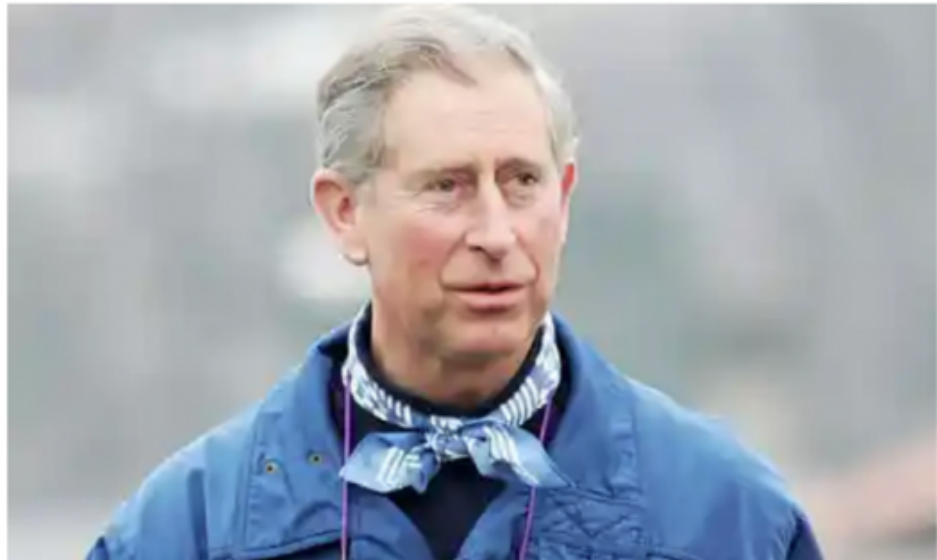
▲ Prince Charles.