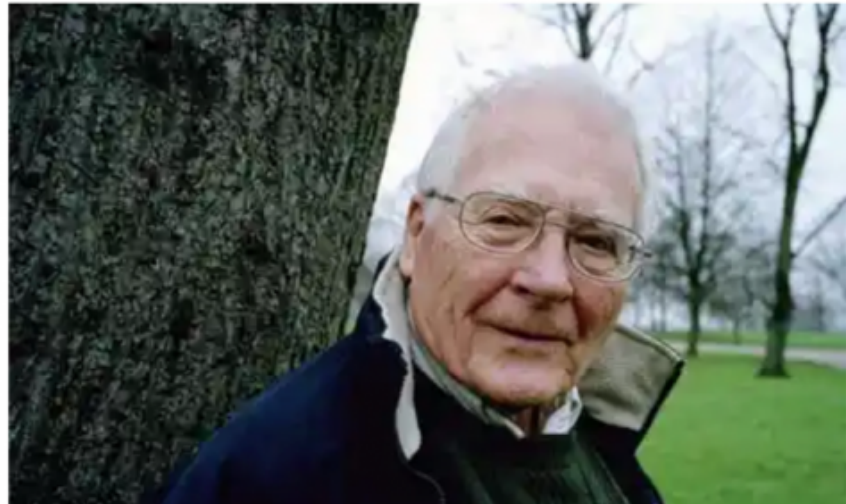
▲ James Lovelock.