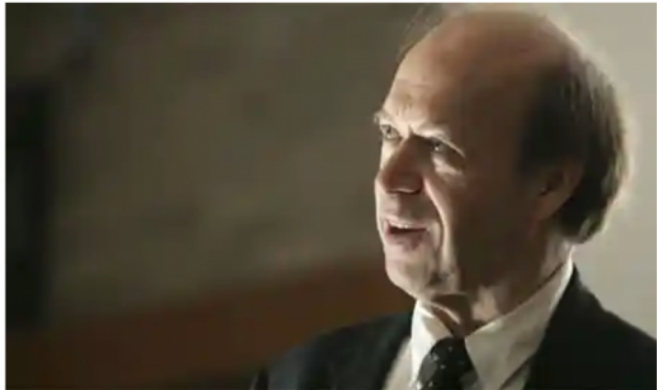
▲ Dr James Hansen.