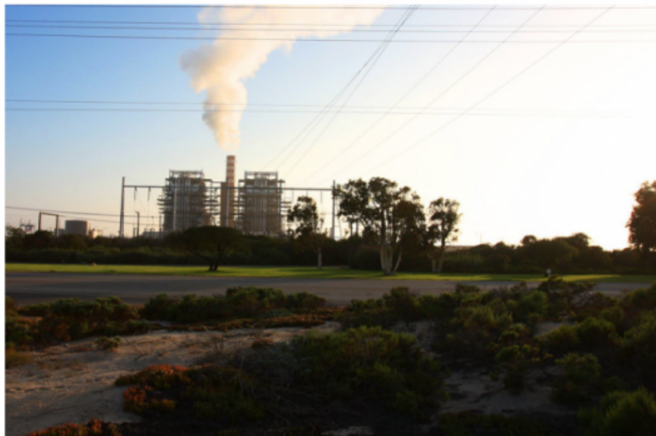
A coal-fired power plant. While coal is in decline globally, Asia is driving new plant development.