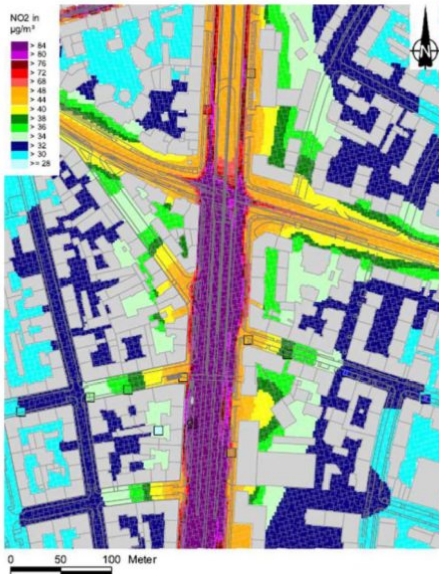
Bild 2. Darstellung der Jahresmittelwerte der NO 2 -Konzentration im Bereich des am stärksten beaufschlagten Abschnitts der Landshuter Allee in München für das Jahr 2011 (Grafik: BLFU)

Es ist schlicht nicht nachvollziehbar, dass Deutschland zu Corona mit Vorgaben in der jetzt erfolgenden Schwere traktiert wird, die nicht auf sauber gemessenen Fakten, sondern auf Schätz- und Daumenwerten ohne wirkliche messtechnische Untermauerung beruht. Angesichts von volkswirtschaftlichen Verlusten in einer Größenordnung von weit über einer Billion Euro ist das in keiner Weise zu rechtfertigen. Es ist die Frage zu stellen, warum man nicht spätestens im April entsprechende Forschungs- und Entwicklungsprogramme aufgelegt und durchgezogen hat. Selbst Beträge von 50 oder gar 100 Mio. Euro wären hier sinnvoll und sogar notwendig gewesen. Besonders im Fokus sollte dabei der öffentliche Personennahverkehr stehen, denn hier werden die Menschen ohne jeglichen Abstand wie Sardinen in der Büchse zusammengepfercht. Und auch wenn ab