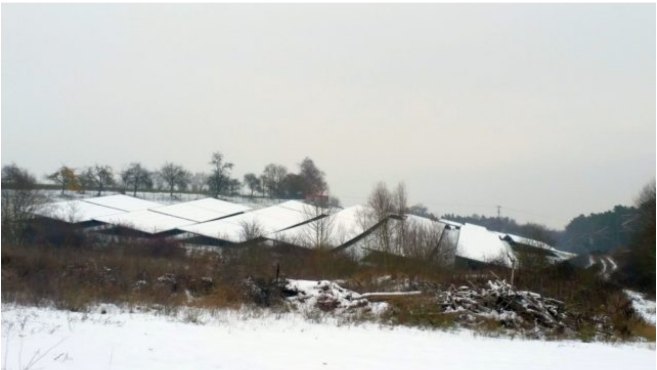
Demmig: Photovoltaik Fläche im Schnee

Daher zu Hause Strom aufladen, und in der Garage vorwärmen.