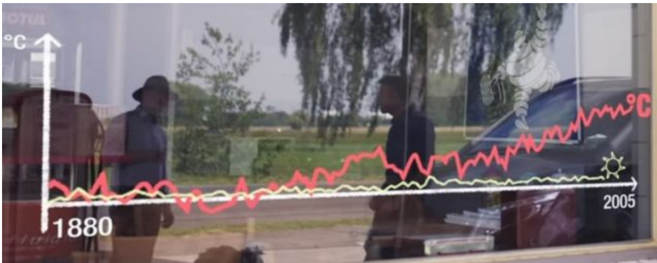
Abb. 1: Der Screenshot aus der Terra-X Sendung vom 18.10.2020 im ZDF zeigt die Sonnenaktivität in einer ungeeigneten gestauchten Skala

Deshalb sieht es so aus als ob die Sonnenaktivität seit 1880 unverändert ist, die Temperatur jedoch ansteigt.