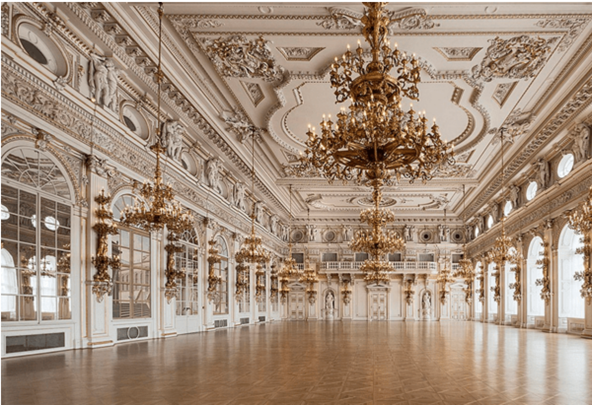
Geothik mit Stil: Der Spanische Saal im Hradschin in Prag