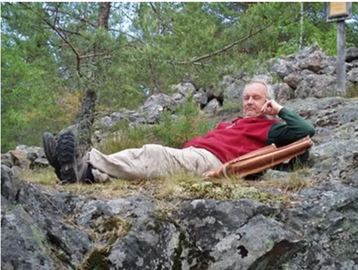
Ruhepause während der Arbeit in Darien