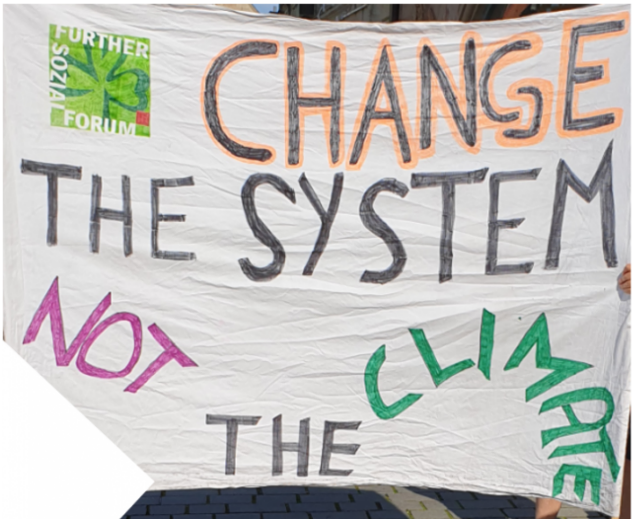
Bild 7 Forderung von Parents for Future. Foto vom Autor von einer lokalen Veranstaltung

Altmaier bekundet damit offiziell, dass sich nun auch seine Partei endgültig dem Diktat von Merkel und der Straße beugte.