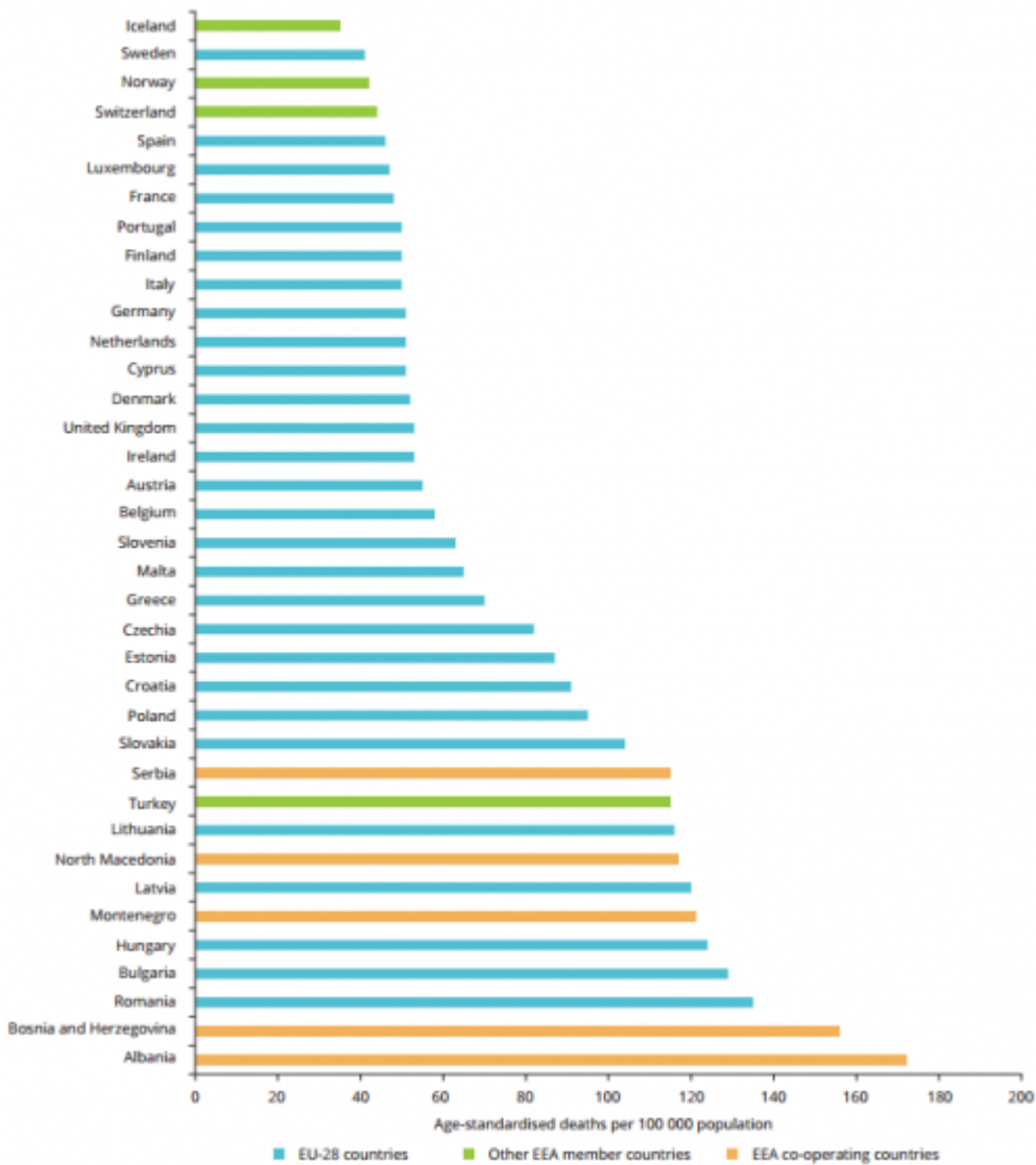
Bild 2 [1] Tabelle: Prozentualer Anteil von Gestorbenen aufgrund von Umwelteinflüssen einzelner Länder (Stand 2012)

Der Extrakt des gesamten EU-Berichtes lässt sich – und wurde – in einer Tabelle zusammengefasst: