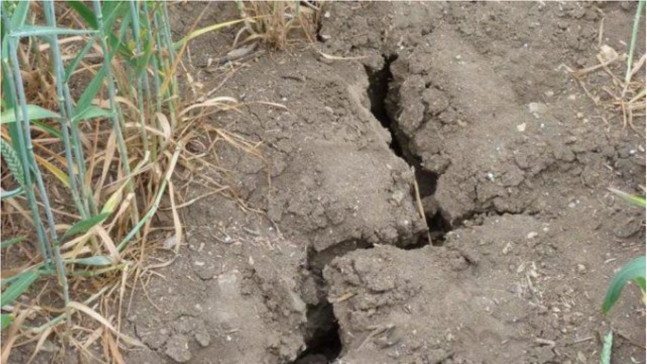
Bild 2a: Anhaltende Dürre 2018 in Teilen Deutschlands – das ist keine Auswirkung einer CO 2 -bedingten Klimaerwärmung.

unbedingt notwendige Bestandteil jeder Fotosynthese und damit jedweden Pflanzenwachstums. Mehr CO 2 in der Atmosphäre führt damit eher zu nasserem Böden und besserem Pflanzenwachstum. Trotz alledem werden die Böden Deutschlands besonders im Sommer trockener.