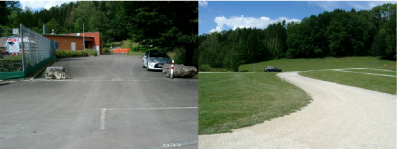
Bild 9. Parkplatz am Ortsrand derselben Gemeinde. Falsch und richtig

6. Flächenversiegelung in den Orten. Viele Parkplätze lassen sich mit Rasengittersteinen auch ökologisch aufwerten oder gleich in der Schotterwiese parken. Selbst der Parkplatzrundweg auf dem Bild ist nicht asphaltiert.