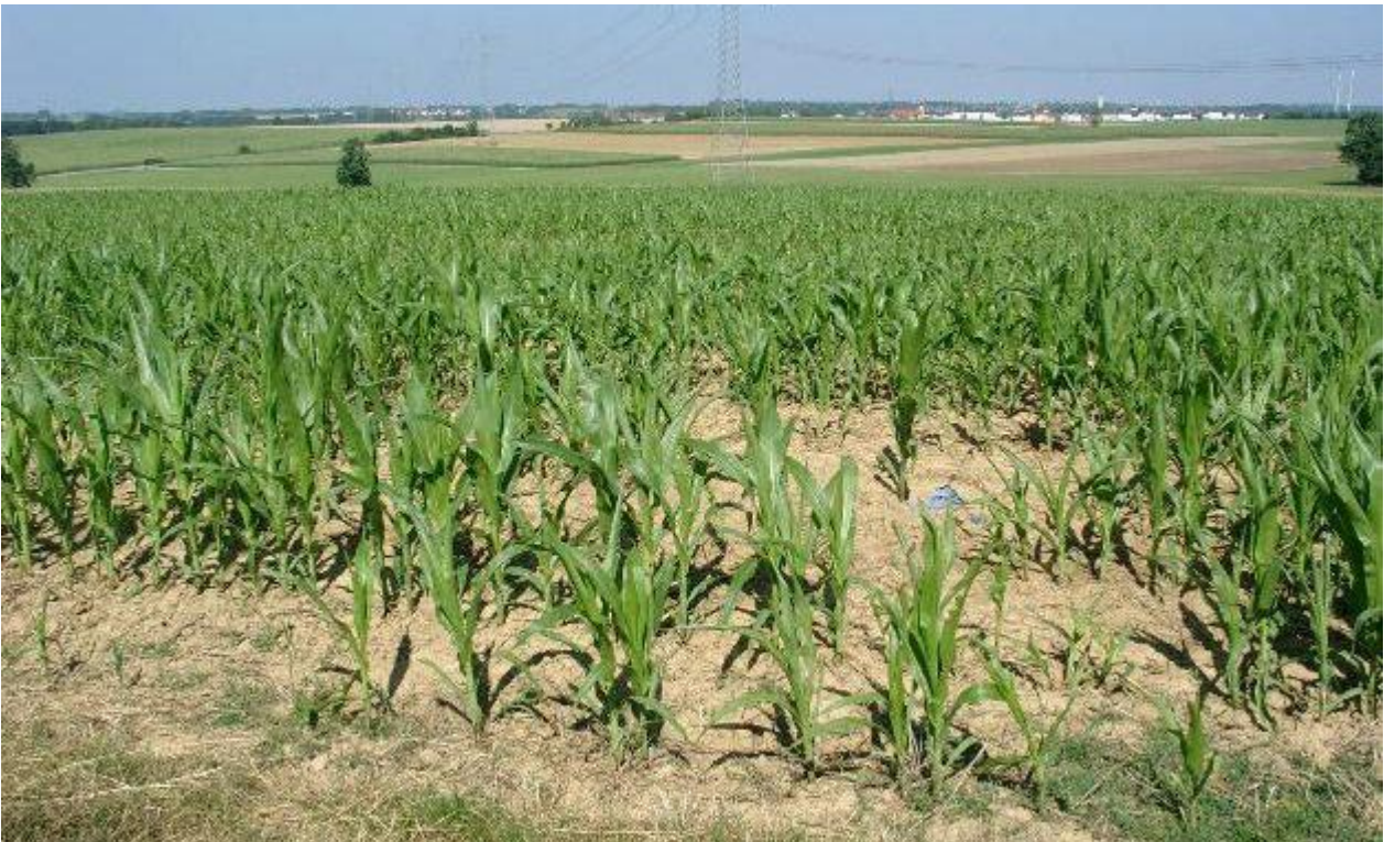
Bild 3: Die Bauern legten hauptsächlich in den letzten 50 Jahren die deutsche Landschaft trocken. Der Erfolg/Misserfolg der teuren Maßnahmen zeigt sich jetzt. Vor dem Aufnahmezeitpunkt hatte es drei Tage lang ausgiebig geregnet. Der durch den Maisanbau entstandenen Betonackerboden kann keine Feuchtigkeit aufnehmen und speichern.