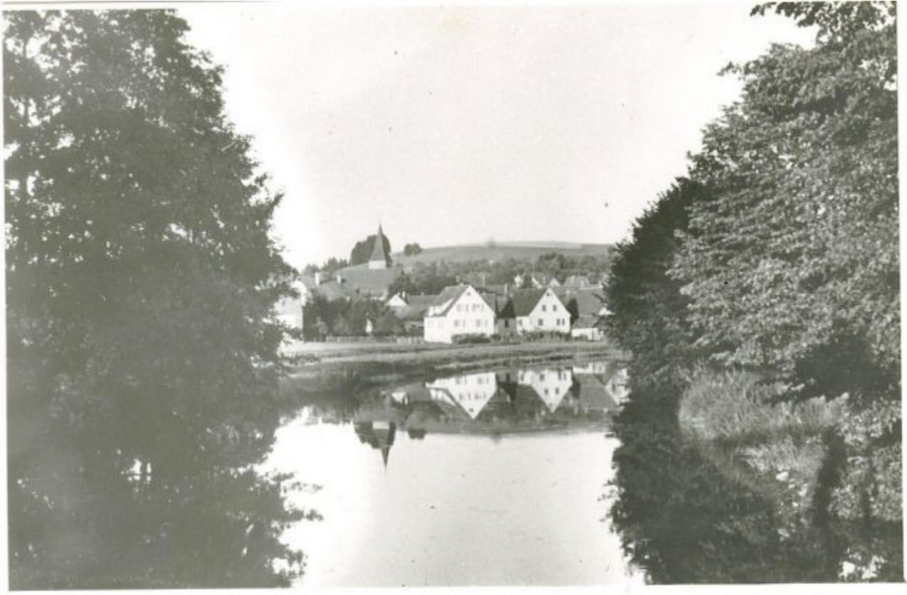
Bild 6, Vor 70 Jahren: Ein ausufernder Kocher im Gebiet Brühl=Bruchwald, heute trockengelegt, begradigt und bebaut.

Aufgrund der ständig ausufernden Bebauung, die sich in einstige Freiflächen hineinfrisst, sind ehemalige Feuchtgebiete und Feuchtwiesen trockengelegt worden. Die Flüsse sind begradigt, oft ausbetoniert und die Überschwemmungszonen=Versickerungszonen sind verschwunden. Als jahrzehntelanger Gemeinderat und guter Naturbeobachter vor Ort konnte ich miterleben, wie die Wiesen und Feuchtauen um unseren Ort zunehmend trocken fielen.