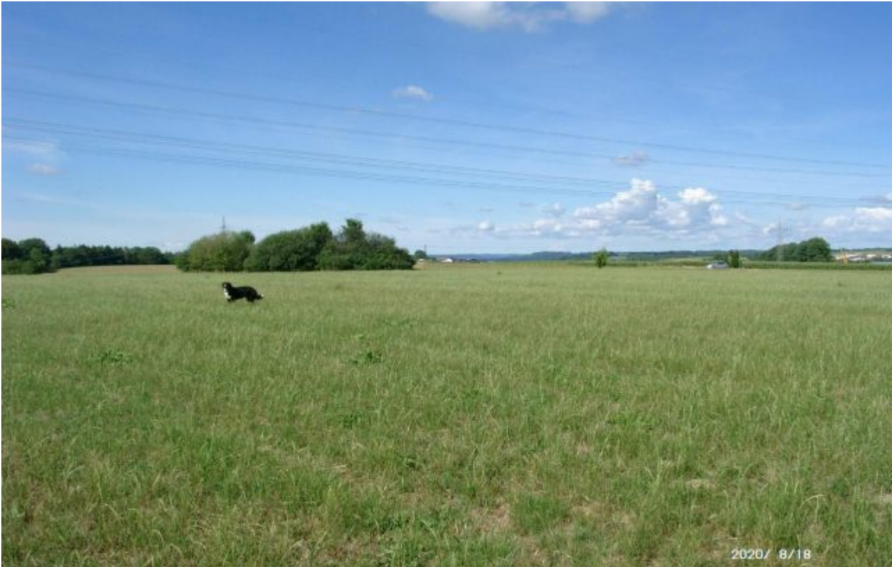
Bild 8. Der letzte verbliebene Tümpel auf einer Hochfläche (hinter dem Hund). Im Mittelalter war die Fläche übersät mit Tümpeln. Die schwäbische Bezeichnung woagarai, falsch übersetzt mit Wagenrain drückt dies aus. Woaga , gesprochen wie schwob, heißt Tümpel, im Fränkischen wooga. Am 18.08.2020 waren bereits 76% der Augustniederschläge gefallen.

2. Das Wasser wird auf den landwirtschaftlichen Flächen in Tümpeln, Erdvertiefungen und Versickerungslöchern zurückgehalten. Versickerung ist notwendig, um die Grundwasservorräte aufzufüllen, aber auch die Verdunstung trägt zur Landschaftsabkühlung bei Hochsommerwetter positiv bei. Regenrückhaltung ist das Gegenteil von schnellem Ableiten, das in den letzten 60 Jahren praktiziert wurde.