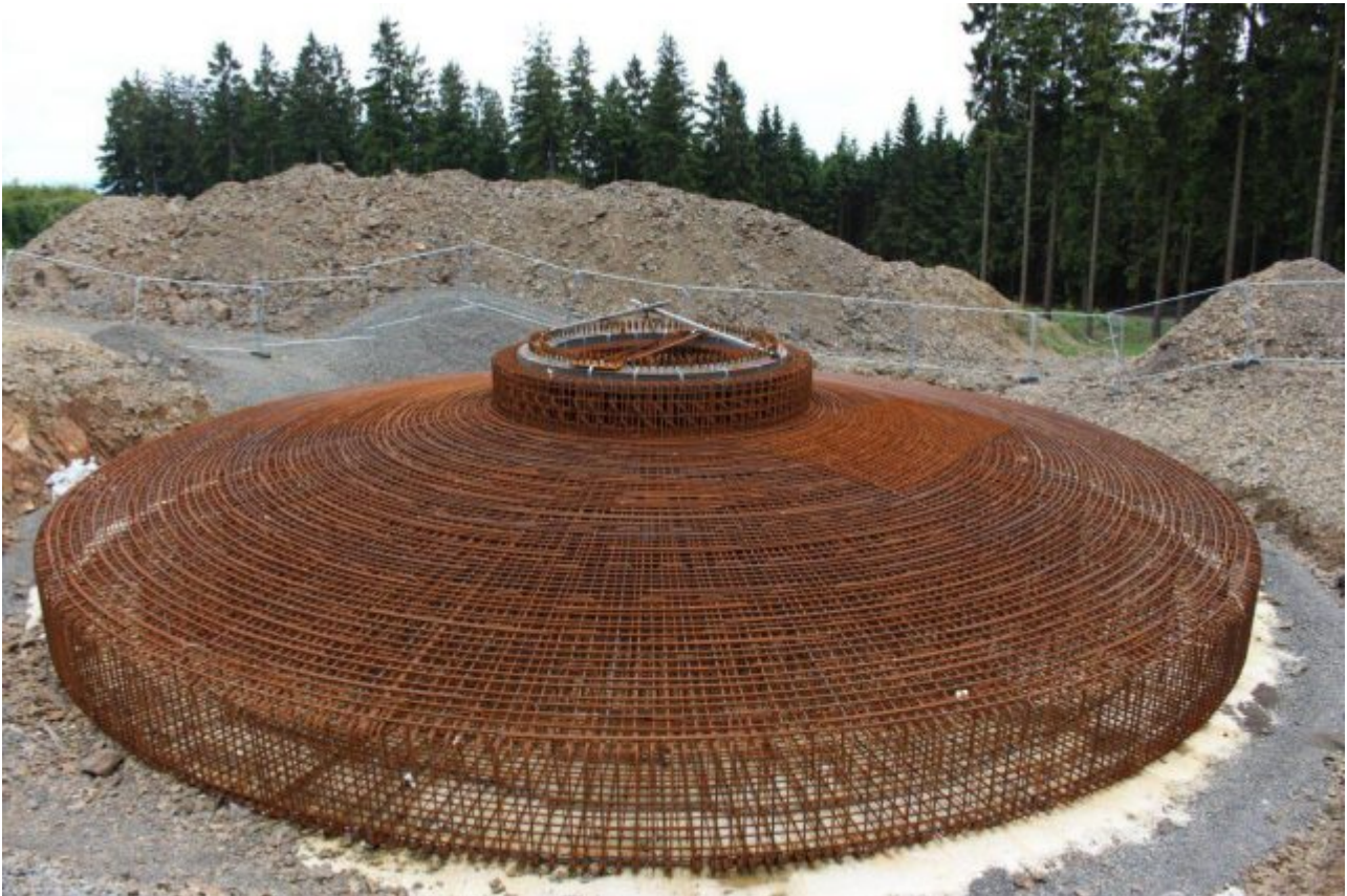
Bild 5 Das Gesamtfundament hat ein Gewicht von 4000 Tonnen.

Über 30 000 Windräder auf den Hochflächen und in den Wäldern: Jedes Windrad erfordert wegen seiner Höhe und seiner Hebelwirkungen eine hohe Standfestigkeit. Der Boden unter Windparks muss besonders trocken sein, weil sonst die Betonfundamente dem Winddruck und der Eigenresonanz der Anlage nicht standhalten würden.