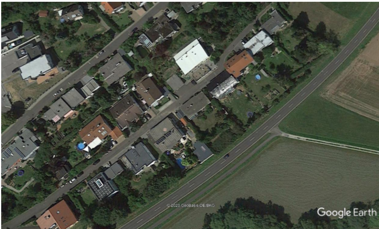
Bild 7: Auf der zugebauten Fläche am Hang des Wettenberges (wet=nass) kann nichts mehr versickern. Das auf dem Bild üppige Grün um die Häuser verkommt in den Sommermonaten zum gelben Trockenrasen. Bei Starkregen wird die landwirtschaftliche Fläche unterhalb kurzzeitig überschwemmt, bei schönem Wetter hingegen schneller austrocknen. Die Erwärmung des gesamten Gebietes ist eine weitere Folgeerscheinung. Straßen und Hausdächer werden in den Sommermonaten bis 60°C heiß und speichern die Wärme bis in die Nachtstunden hinein.

Kuriose Siedlungs-Namen: In Wohngebieten wie Wasserstall gibt es kein stehendes Wasser mehr, im Baugebiet Teich keine Teiche und im Brühl stehen alle Häuser im Trockenen, kein versumpfter Bruchwald weit und breit. Der letzte Restsumpf wurde in meinem Heimatort vor 35 Jahren trockengelegt, als ein Schäfer festsaß. Wir haben in Deutschland fast keine Auen mehr, in welchen Wasser versickern darf. Regenwasser wird nicht in Überflutungswiesen zurückgehalten, sondern möglichst schnell abgeleitet. Die menschengemachten, einst gut gemeinten, in der Wirkung aber großflächige Naturzerstörungen nach dem Kriege brachten zunehmend die Trockenheit in die deutsche Landschaft. Nahezu jede weitere Baumaßnahme macht täglich den Boden trockener. Wir stehen erst am Anfang des Problems „Versteppung der Landschaft“ in Deutschland. Mit CO 2 und Klimawandel hat das nichts zu tun. Man braucht nur 5 bis 10 Häuser mit einer Zufahrtsstraße in eine Nasswiese stellen und 10 Jahre später ist der Fremde erstaunt über die Bezeichnungen der Siedlungen wie Wasserfurche, Fuchsloch, Lachwiese, Horlach,