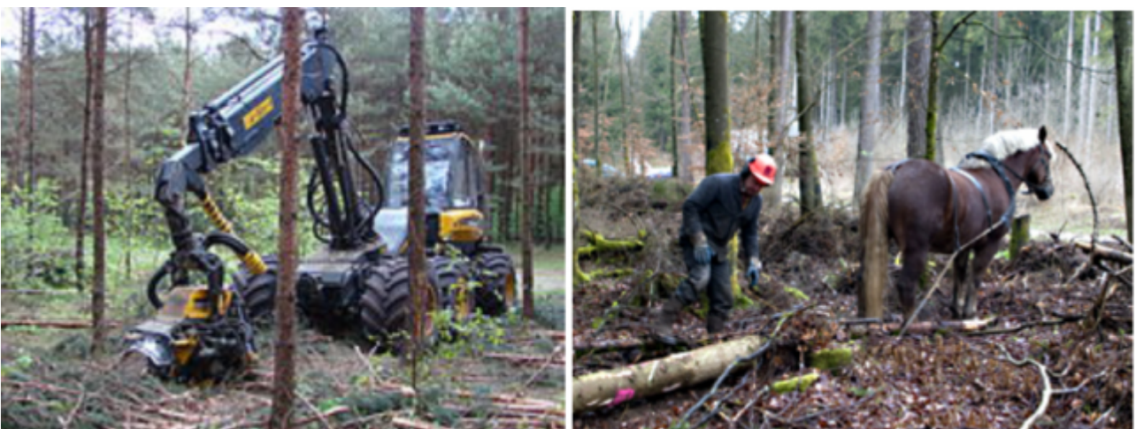
Bild 4: Die schweren Erntemaschinen brauchen feste Zufahrtswege mit drainiertem Untergrund und einen trockenen Waldboden, unzählige Ablaufgräben führen das Wasser aus dem Wald hinaus. Die Erntemaschinen verdichten zusätzlich den einst schwammigen, Wasser speichernden

Die Zeit der Pferdefuhrwerke und Pferde zum Holzrücken sind längst vorbei. Man schlägt nicht mehr Holz, sondern man erntet mit Großmaschinen, den Harvestern.