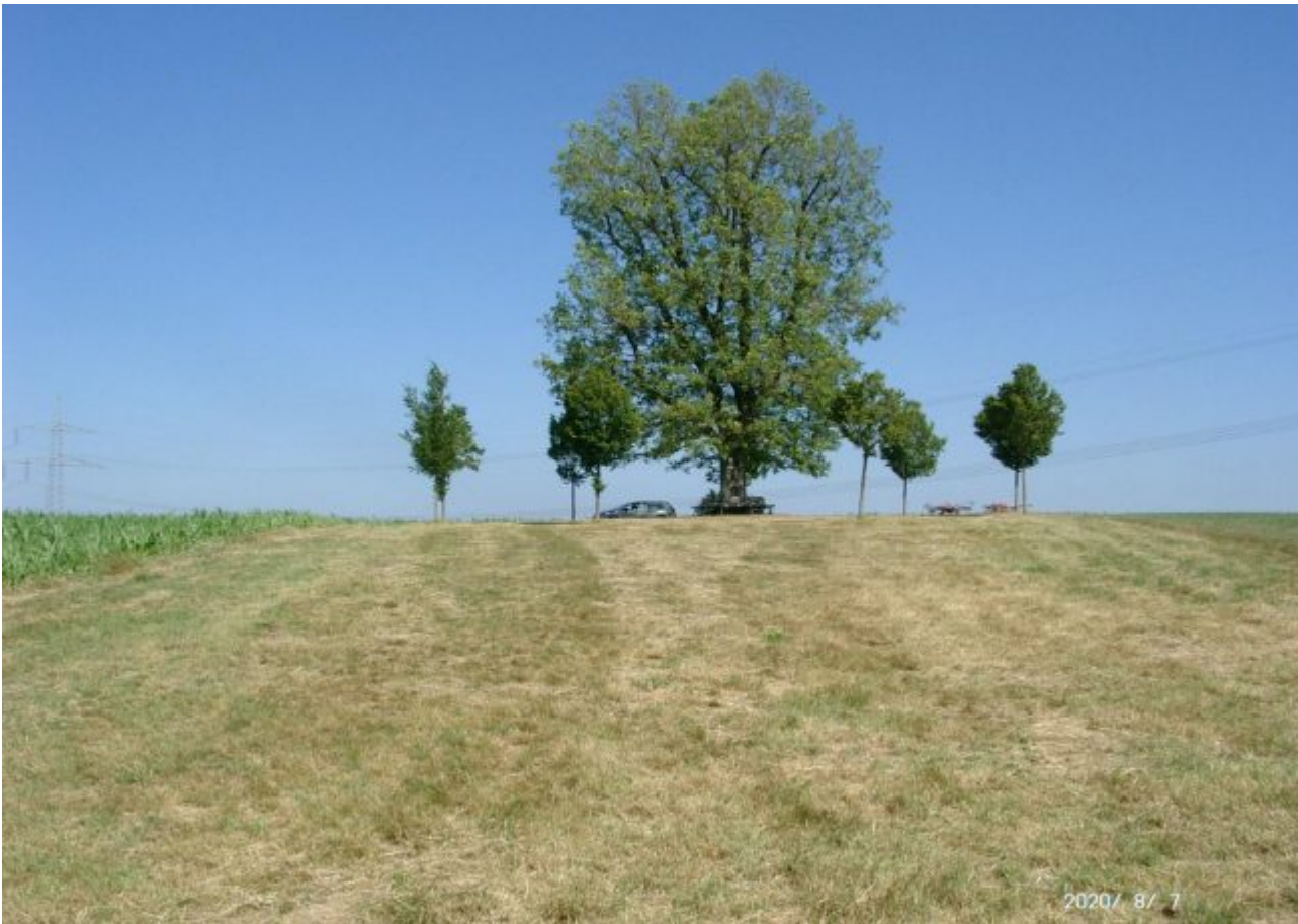
Bild 2b: Die Aufnahme zeigt eine Hügelkuppe im Ostalbkreis in Süddeutschland, vor der Aufnahme hatte es drei Tage lang anhaltend 40% des gesamten Augustniederschlages geregnet, und trotzdem ist der Untergrund sehr trocken.