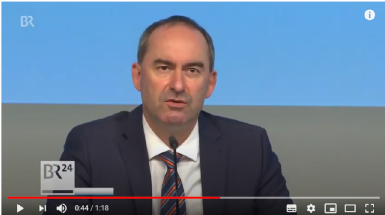
Bild 2 BR24 Video vom 29.05.2020, Vorstellung der Bayerischen Wasserstoffstrategie. YouTube Link

H. Aiwanger ab 00:44: Russland würde uns Wasserstoff in beliebigen Mengen zu günstigen Preisen liefern können. Wir denken an Nordafrika. Es kann Marokko sein. Und es sind große, internationale Herkünfte von Australien bis Chile in der Debatte.