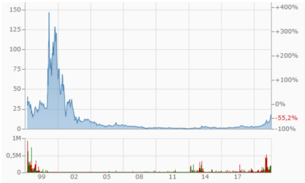
Bild 1 Kurs Ballard Power seit Beginn des ersten Brennstoffzellenbooms Ende des letzten Jahrhunderts

Geradezu ein Veteran ist dieser Technologie ist die Firma Ballard Power. Auch damals geschah etwas Ähnliches – und scheiterte gnadenlos. Der Aktienkurs erzählt lückenlos diese Geschichte, deren Wiederholung nun ansteht: