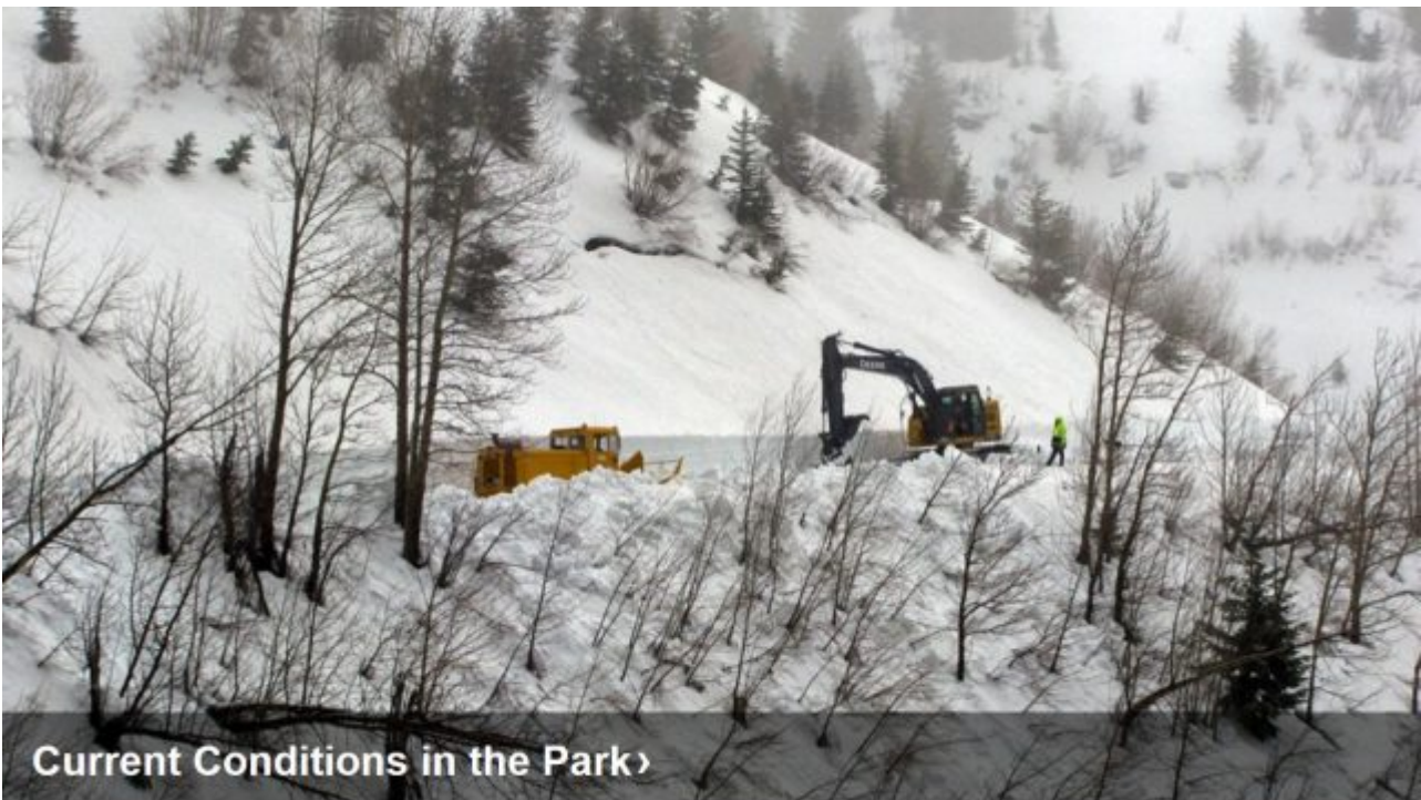
Crews are active working to reopen the Going-to-the-Sun Road

In seinem Buch aus dem Jahr 2006 An Inconvenient Truth posaunte Al Gore außerdem hinaus, dass es bis zum Jahre 2012 im Glacier National Park keine Gletscher mehr geben werde. „Unser heimischer Glacier National Park muss sehr bald umbenannt werden zu ‚Der Park der ehemaligen Gletscher‘“, schrieb Gore. Jedoch ... wir befinden uns im Jahr 2020, und die Gletscher im Park sind üppig und vielfältig. Also noch eine grandios gescheiterte Prophezeiung von ihm.