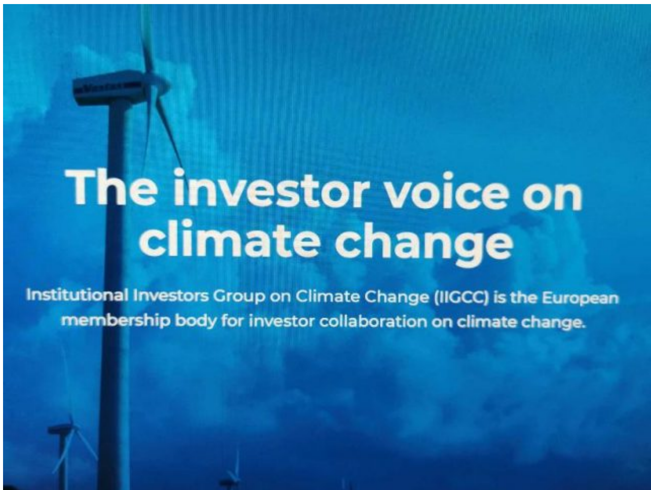
Bild 5. Die IIGCC ist ein Zusammenschluss von europäischen Großanlegern, der Firmen auf Kurs bringt, die sich nicht ausreichend für „Klimaschutz“ engagieren. Freie Marktwirtschaft war gestern

Auch dieser Zusammenschluss aus fast 200 europäischen Großanlegern will in seinem Umfeld mehr Druck für einen strengeren Klimaschutz ausüben.