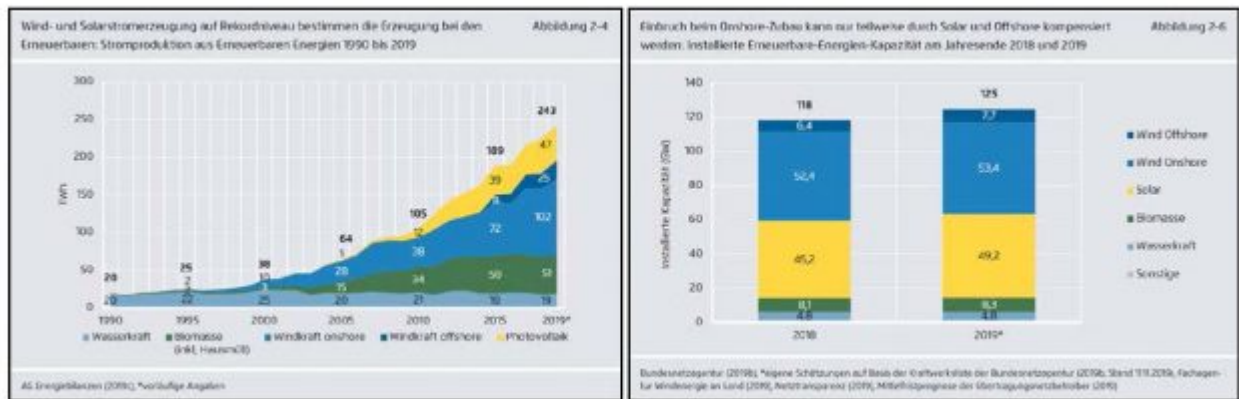
Bild 3: Links: Stromproduktion aus erneuerbaren Energien 1990 – 2019 (AE, S. 20, Abb. 2-4). Rechts: Installierte Erneuerbare-Energien-Kapazität 2018 und 2019 (AE, S. 22, Abb. 2-6)

Augenfälliger wird das Problem, wenn wir uns auf Wind- und Sonnenenergie fokussieren: