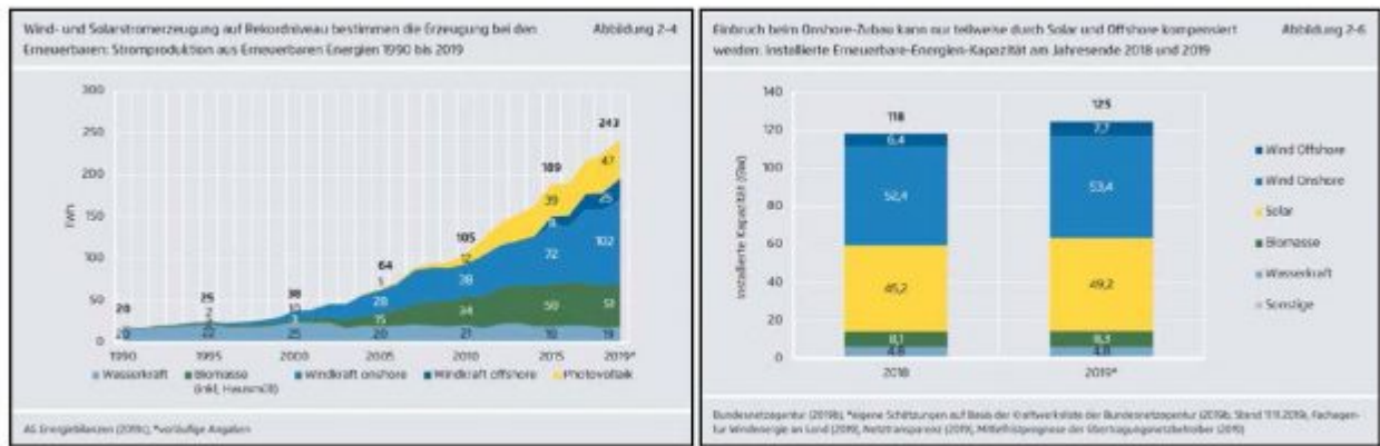
Bild 3: Links: Stromproduktion aus erneuerbaren Energien 1990 – 2019 (AE, S. 20, Abb. 2-4). Rechts: Installierte Erneuerbare-Energien-Kapazität 2018 und 2019 (AE, S. 22, Abb. 2-6)

Augenfälliger wird das Problem, wenn wir uns auf Wind- und Sonnenenergie fokussieren: