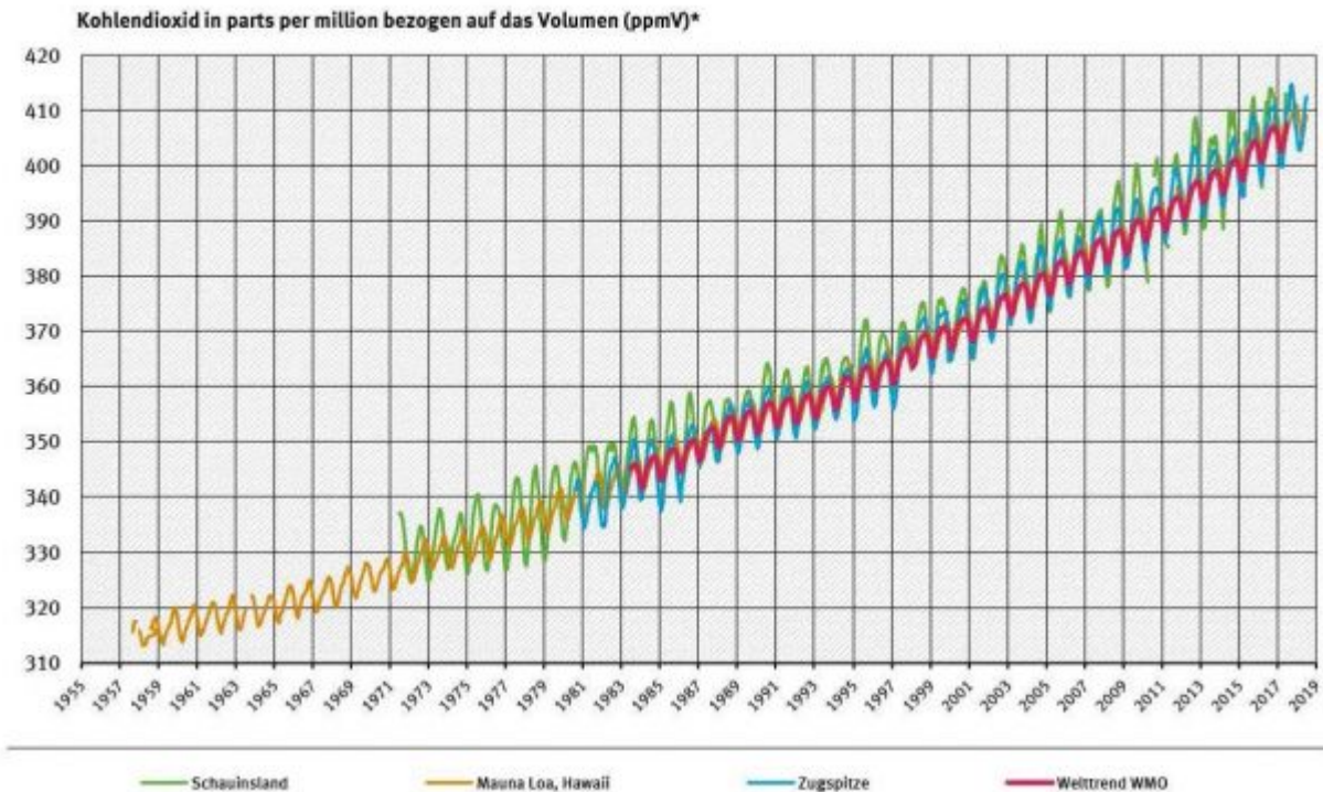
Bild 1: CO 2 -Volumenkonzentration der Atmosphäre, gemessen auf Mauna Loa, Hawaii, rund 4100 m üNN (hellbraun), Schauinsland (grün) und Zugspitze (blau), Grafik des Umweltbundesamts [4]. Der Welttrend ist in rot. Die auffälligen Fluktuationen, die sich dem Anstieg überlagern, sind Effekte jahreszeitlich und örtlich bedingter Schwankungen der Photosynthese, die sich mit zunehmender Höhe immer weniger bemerkbar machen.

Weitere Messungen auf Inseln oder in Gegenden ohne menschliche Besiedelung, bestätigen die in Bild 1 gezeigten Daten. Im Gegensatz zum steten Anstieg in Bild 1 schwankt aber der bodennahe CO 2 -Gehalt der Atmosphäre oft ungewöhnlich stark. Insbesondere in Städten kann er Werte erreichen, welche die Mouna-Loa-Konzentrationen weit übertreffen. Historische Messungen von bodennahen CO 2 -Konzentrationen, wie sie in den Unterlagen zahlreicher Universitätsinstitute aufzufinden sind, bestätigen diese Schwankungen auch für die letzten 100 bis 150 Jahre. Wie ist der Widerspruch von Bild 1 mit diesen starken Schwankungen zu erklären?