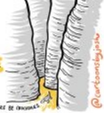
THREE BE ORIGINAL

EARLY CARTOONIST USES WALLS INSTEAD OF IPAD