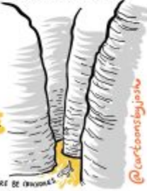
THREE BE ORIGINAL

EARLY CARTOONIST USES WALLS INSTEAD OF IPAD