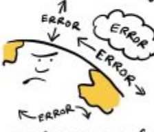
THE ACCIDENTAL CLIMATOLOGIST

LET'S PRETEND THEY ALL CANCEL EACH OTHER OUT