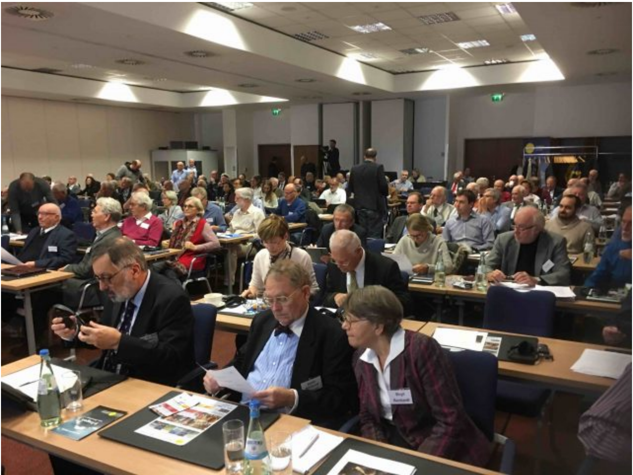
Auditorium 12. IKEK

Die Medien waren – wie fast immer- nur sehr karg vertreten. Lediglich der Münchner Merkur sandte für den ersten Tag einen Redakteur, brachte aber bis zum Erscheinen dieses Artikels – online- keinerlei Bericht über diese Konferenz.