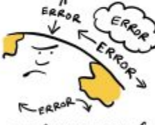
THE ACCIDENTAL CLIMATOLOGIST

LET'S PRETEND THEY ALL CANCEL EACH OTHER OUT