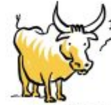
PARADISE LOST I GOT POLLENS!!