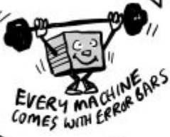
EVERY MACHINE COMES WITH ERROR BARS