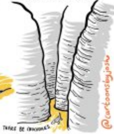
THREE BE ORIGINAL