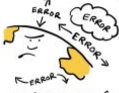
THE ACCIDENTAL CLIMATOLOGIST

LET'S PRETEND THEY ALL CANCEL EACH OTHER OUT