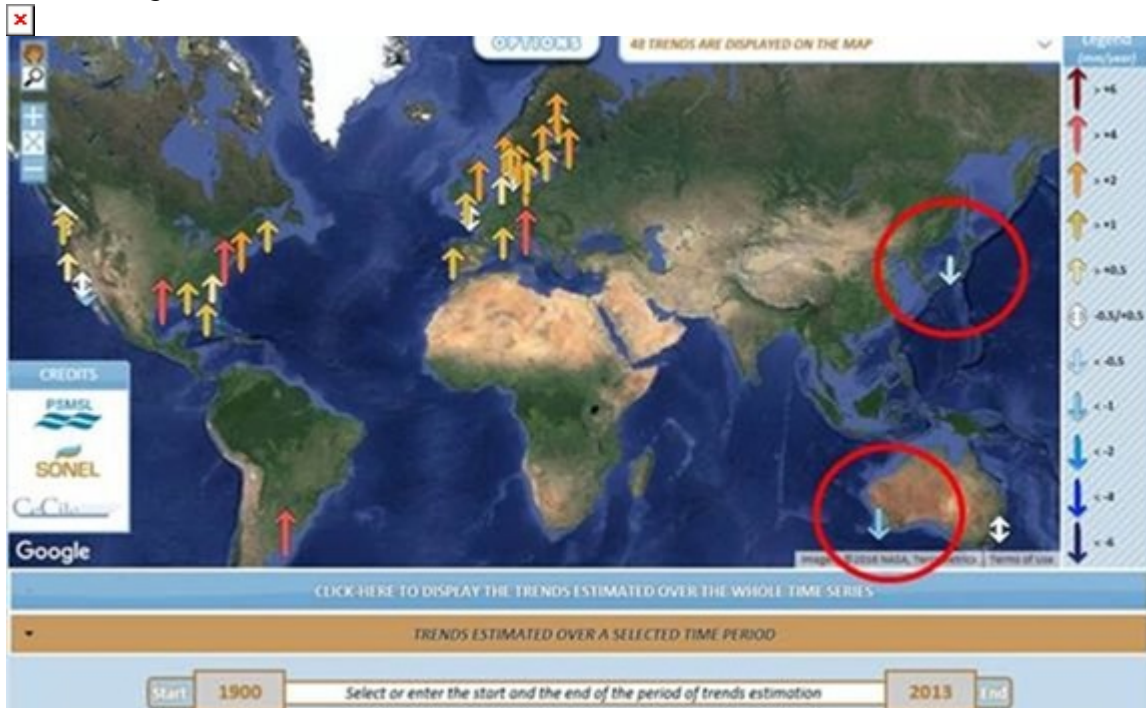
Abbildung 2 – Absolute Meeresspiegelanstiegsraten (relative Meeresspiegelanstiegsrate von der Pegelmessung, absolute vertikale Landbewegung (Geschwindigkeit) von Satelliten-GPS) in den Welt Tide-Messungen mit theoretisch gleichen Daten 1900 bis 2013, vor und nach Fremantle wurde eliminiert. Bilder sind reproduziert und modifiziert von SONEL, www.sonel.org . (oberes) Bild heruntergeladen am 6. Juni 2018.

Wenn man sich die Bilder von Abbildung 2 unten anschaut, mit dem gleichen Zeitfenster für die Online-Grafik, ist der negative absolute Meeresspiegelanstieg von Fremantle, ähnlich wie der negative absolute Meeresspiegelanstieg einer japanischen Flut, verschwunden. [also Absenkung]