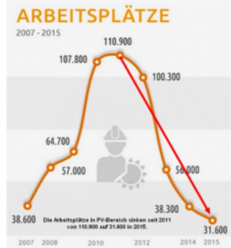
Bild 2 [15] Anschauliche Darstellung, wie sich ein Markt nach Reduzierung staatlicher Fehl-Subventionierung bereinigt

Bei öffentlicher Elektromobilität fällt auf, dass praktisch überall, wohin man danach in Deutschland googelt, ein vom Bund gefördertes und von einem Uniinstitut „begleitetes“ – also mindestens öffentlich teilfinanziertes – Projekt dahinter steckt.