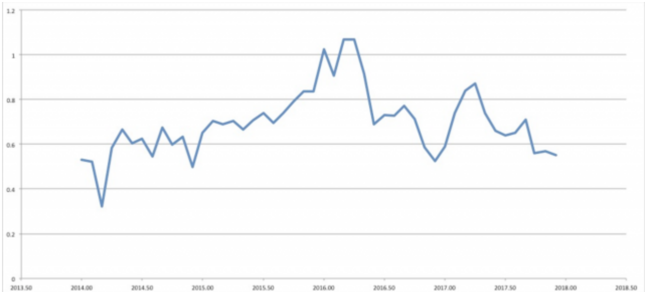
Abbildung: Die globalen Temperaturdaten von HadCRUT4 (2014 bis 2017) widerlegen die Aussage, dass die Wärme des Jahres 2017 einem Wiederaufleben der globalen Erwärmung geschuldet ist. Die Welt hat sich vielmehr abgekühlt.

Die Aussage, dass die Wärme des Jahres 2017, einem „Nicht-El-Nino-Jahr“ auf die globale Erwärmung zurückzuführen ist, lässt sich nicht aufrecht halten. Die Temperatur-Struktur des Jahres spricht dagegen. HadCRUT4 zeigt dies ziemlich eindeutig: