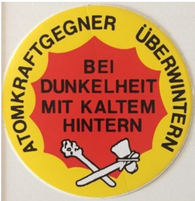
Abb.4: Zur verteufelten Kernenergie hat sich mittlerweile die Energie aus fossilen Energieträgern gesellt. Die Steinzeit rückt somit immer näher.

Eine verfehlte Energiepolitik vernichtet hunderttausende Arbeitsplätze, weil durch die teure Energie Industrie und Wirtschaft nicht mehr in Deutschland produzieren können, da deren Produkte dadurch immer teurer werden und nicht mehr wettbewerbsfähig sind. So liegt in Schlüsselindustrien der Energiekostenanteil bei 10% und mehr. Nicht umsonst baut China* in seiner Planung bis 2020, nein, nicht die Erneuerbaren Energie aus, sondern billig erzeugte Energien aus Kohle- und Kernkraft.