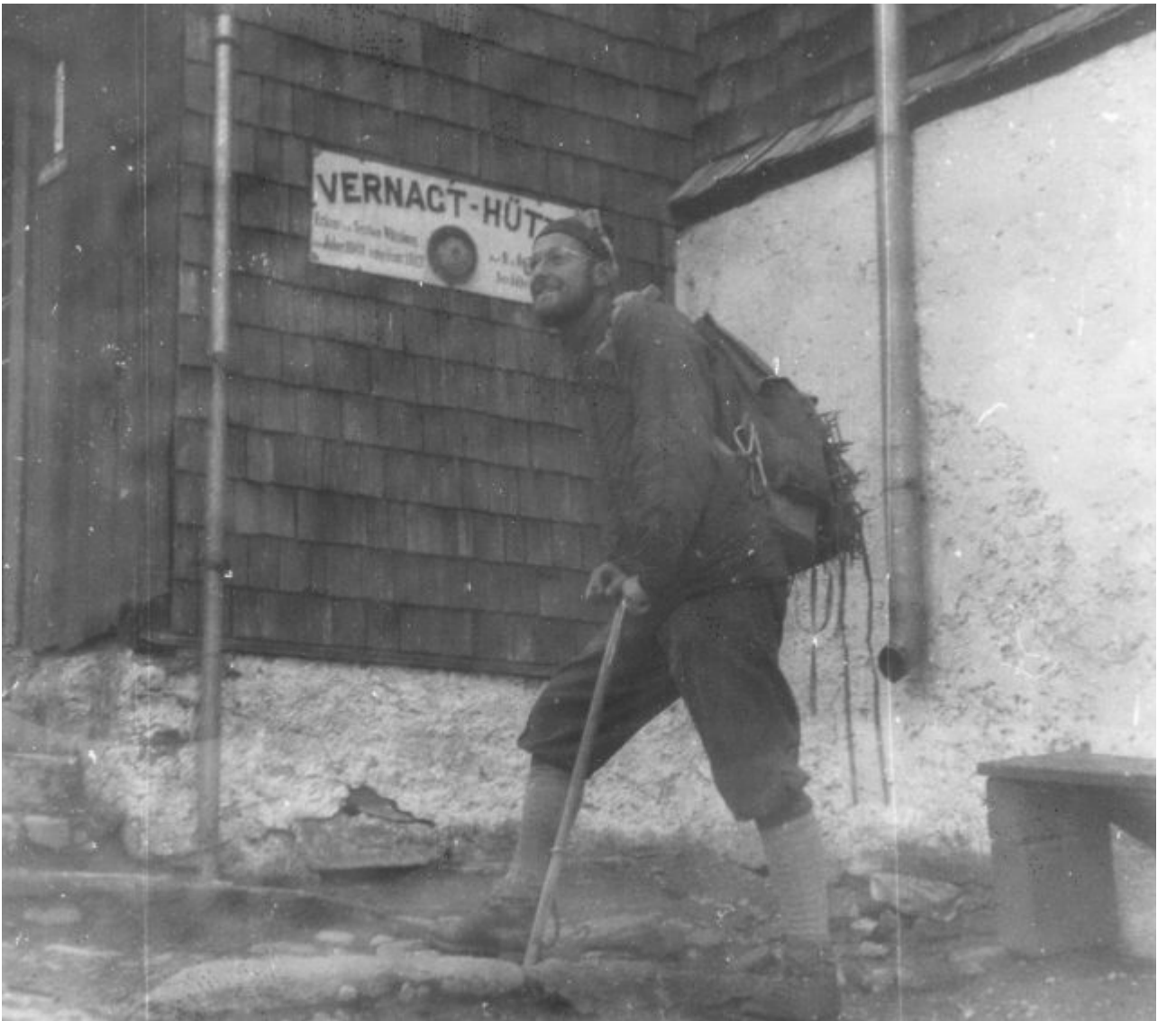
Abb. 7 Rückkehr des Autors vom Vernagtferner 1964