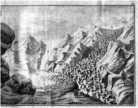
Abb 3 Der Rofener Eissee am 16. August im Jahr 1772, Kupferstich (Walcher 1773) *)

Bewohner des Ötztales angesagt, die in Zukunft von großen Überflutungen durch ausbrechende Gletscherseen als Folge der seit damals stattfindenden natürlichen Erwärmung verschont bleiben dürften.