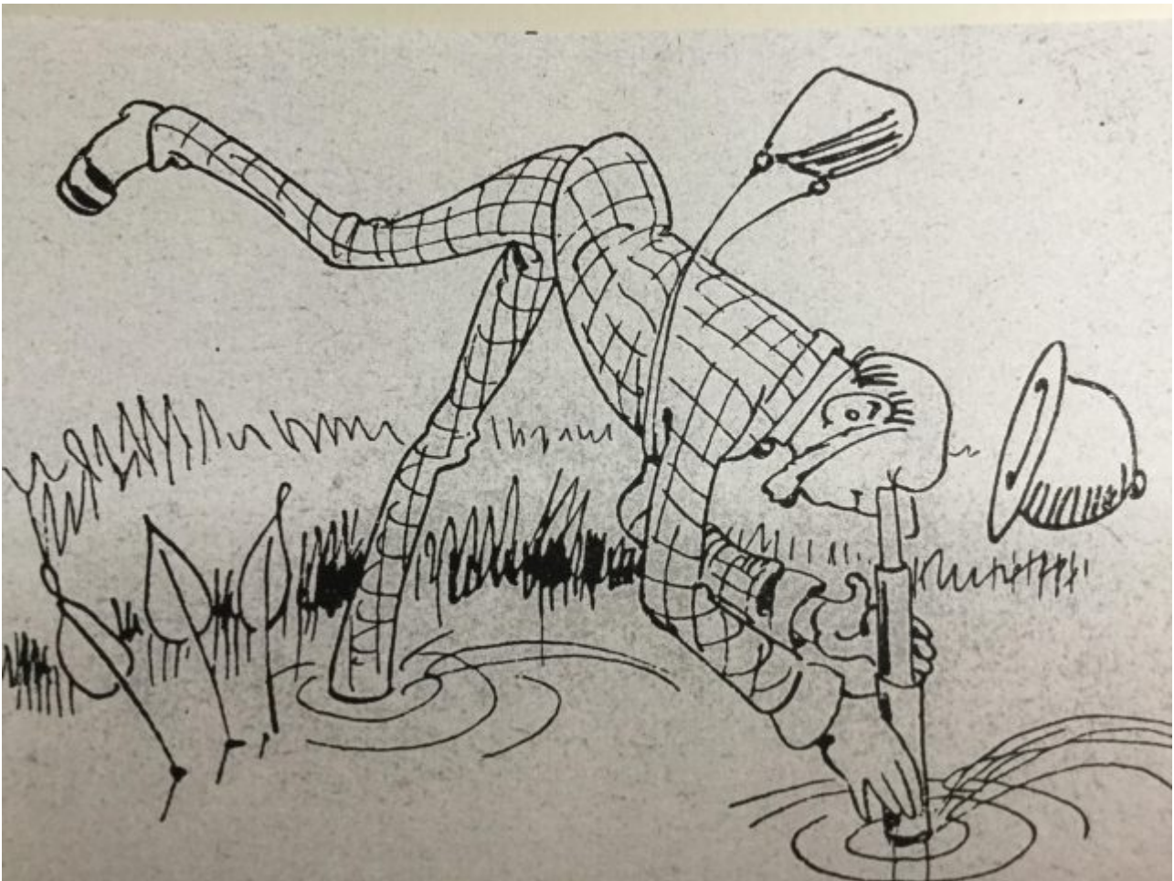
Abb. 6 Der weitsichtige Blick unserer Politikerkaste in die Zukunft unserer Republik Wilhelm Busch 1924*)