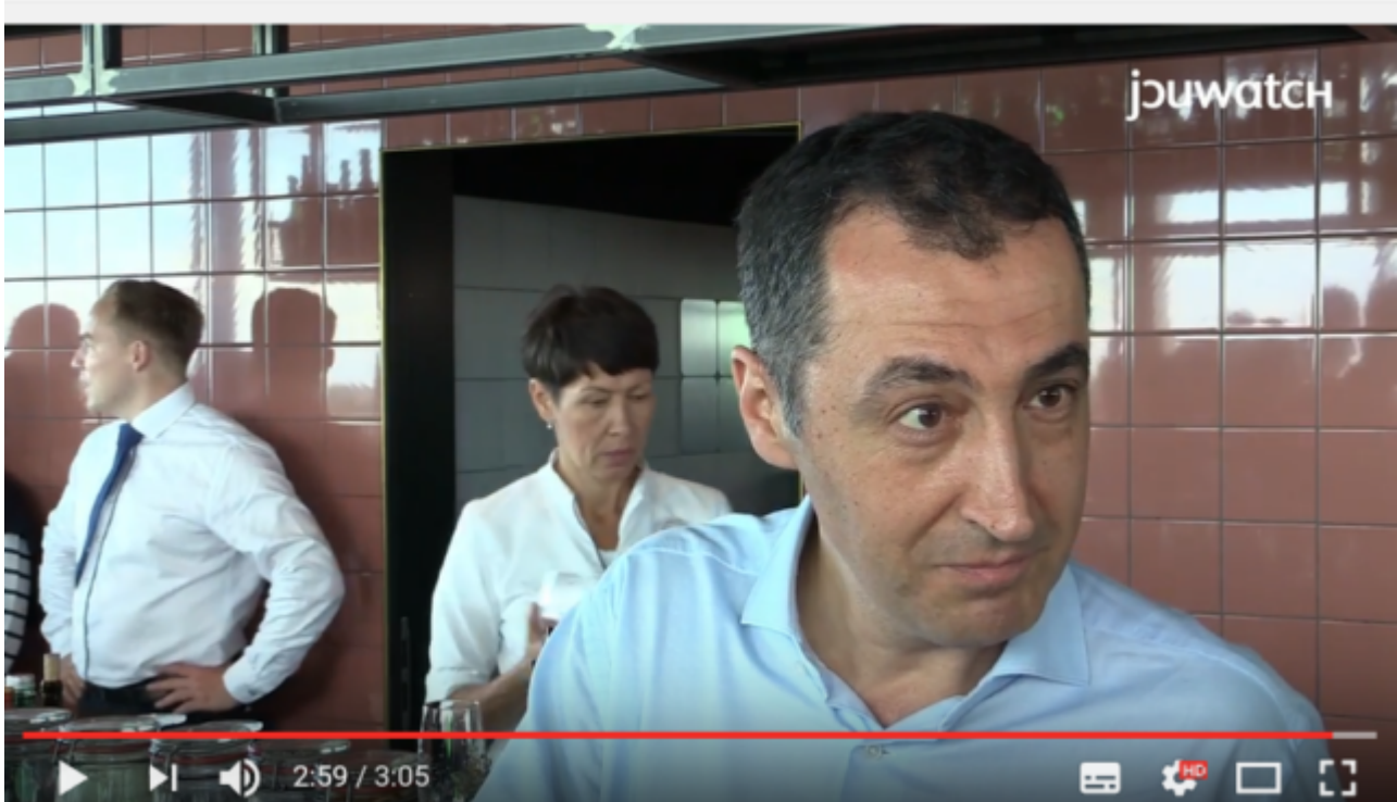
Özdemir beim Abschlussstatement an Reporter. Screenshot vom Video

Cem Özdemir: „ ... Wir haben es geschafft, dass wir bei der Verdichtung des Programms oder Zusammenfassung alles, was Rang und Namen hat in der Partei hinter uns versammeln konnten. Von Winfried Kretschmann .... C. Roth, bis zu Jürgen Trittin. Alle unterstützen das. Das zeigt: Die GRÜNEN sind einig und wissen, was sie wollen.“