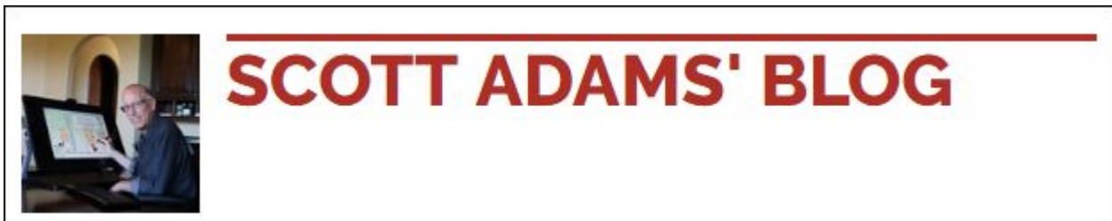
Screenshot Scott Adams Blog