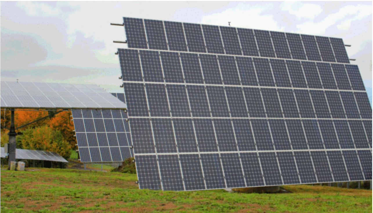
Bild 4. Im Bereich Fotovoltaik sind chinesische Hersteller an der Weltspitze

Kapazitäten bei Wind von 129 GW auf 210 GW und bei Solar von 43 GW auf 110 GW ausbauen wolle, was dann noch auf auf 250 GW Wind und 150 GW Solarkapazität aufgestockt wurde [CHDI].