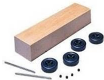
Abbildung 1: Grundbestandteile einer Seifenkiste

Dies ist genau so, als ob man sagt, dass eine Seifenkiste eine gute Approximation eines Rolls Royce oder eines Ferrari ist. Als Beweis führen sie an, dass die Seifenkiste anscheinend einige Spuren-Charakteristika hat und der Straße in der gleichen Richtung folgt – falls sie sich auf einem Hügel befindet.