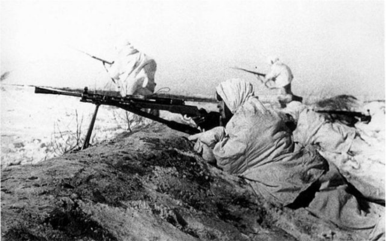
Russischer MG Trupp im Winterkrieg

Heute ist es die NPD (deutsche Neonazis) die stramme Gläubige der menschengemachten globalen Erwärmung ist. Nichts Neues wirklich.