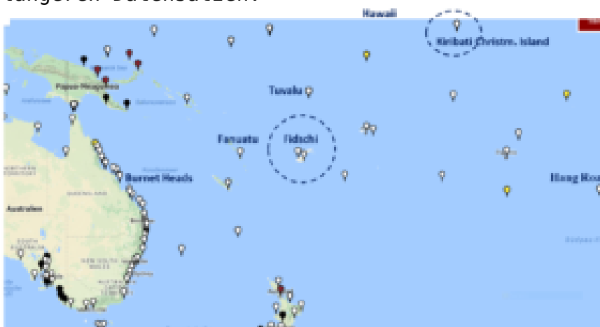
Bild 2 Pazifik, Lage von Pegelstationen.

Im folgenden Übersichtsbild sind die zwei im Bericht genannten Atolle gekennzeichnet und zusätzlich Standorte von Pegelstationen mit teils längeren Datensätzen.