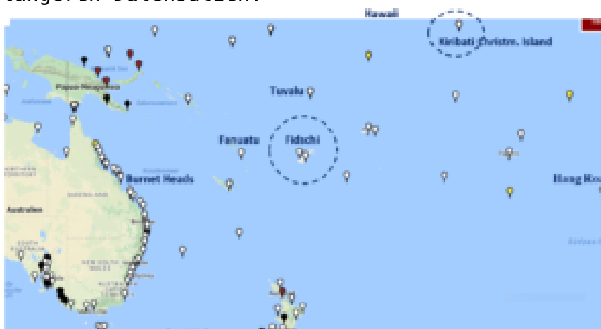
Bild 2 Pazifik, Lage von Pegelstationen.

Im folgenden Übersichtsbild sind die zwei im Bericht genannten Atolle gekennzeichnet und zusätzlich Standorte von Pegelstationen mit teils längeren Datensätzen.