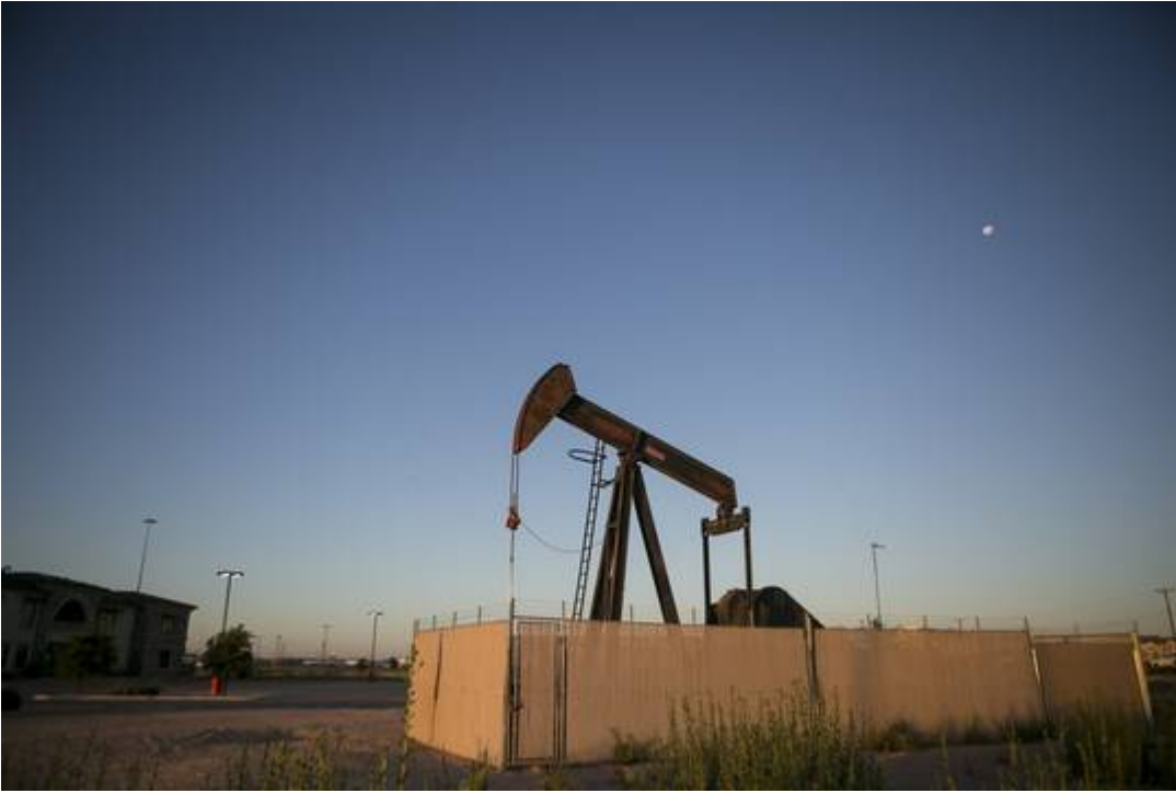
Ölpumpen außerhalb von Midland, einer Ölstadt in West Texas

– wie angenehm der Anblick, verglichen mit einem Windenergieanlage – der Übersetzer