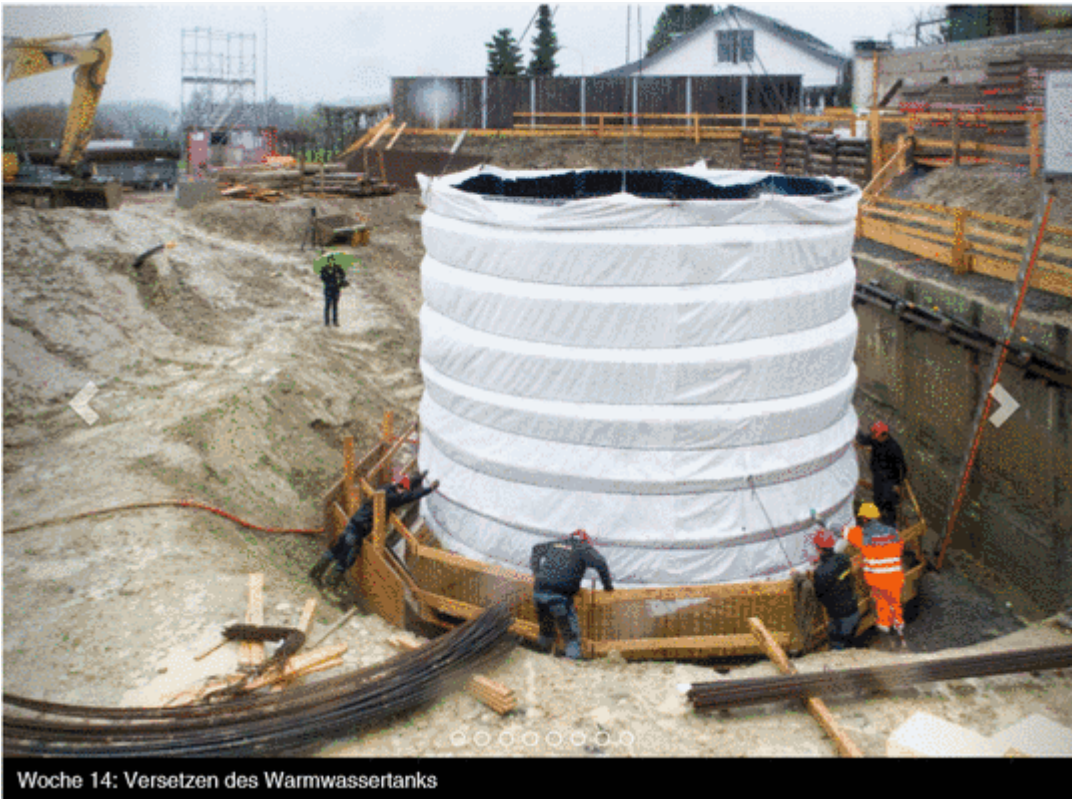
Bild 3 Unterirdischer Warmwassertank (davon sind zwei verbaut).