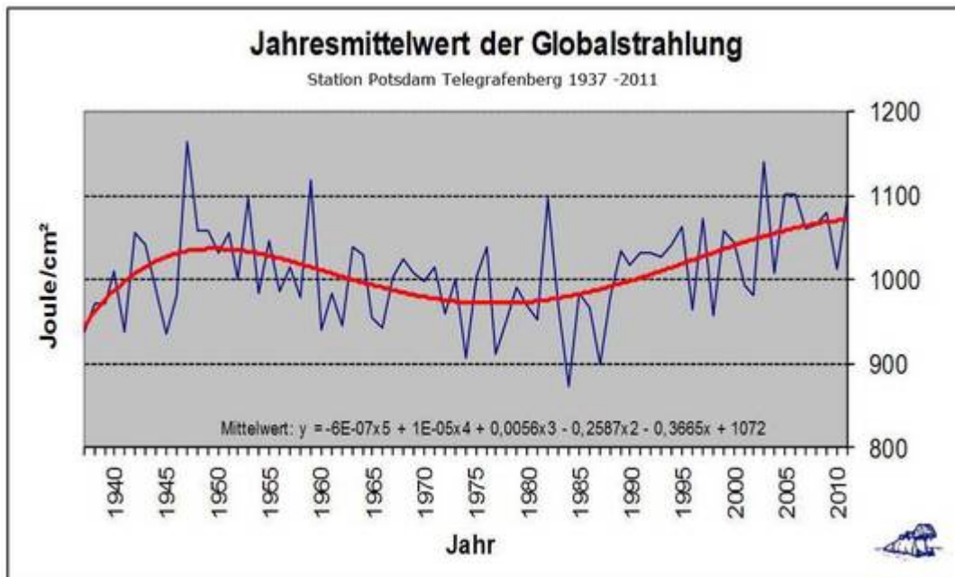
Abbildung 2: Gemessene Globalstrahlung an der Station Potsdam Telegrafenberg 1937-2011 [3]. Anmerkung: Die Einheit für die Globalstrahlung ist 1 Joule = 1 Watt x 1 Sekunde = 1 Ws. 1000 Joule/cm 2 entsprechen damit einem Wert von 2,78 kWh/m 2

Strahlungsstärke und Klimawirksamkeit sind völlig unterschiedliche Begriffe und werden von der modernen Klimawissenschaft meist synonym verwendet, um den Klimaeinfluss der Sonne zu marginalisieren. Die Globalstrahlung zeigt mit einer Variabilität von mehr als 10 Prozent aber sehr viel größere Schwankungen, als sie allein aus der Veränderung der Solarkonstanten von knapp 1 Promille über die solaren Zyklen zu erwarten wären.