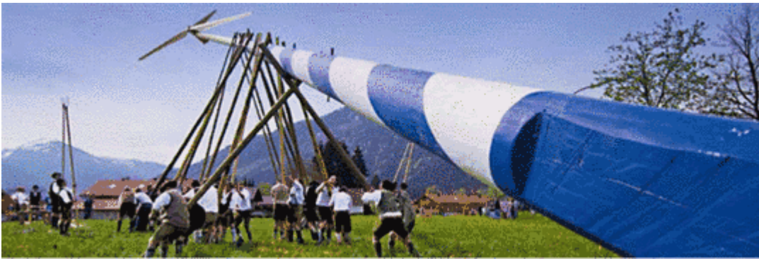
Bild 3, (Vermutung des Autors) Endlich auch für Oberbayern zugelassene Windrad-Ausführung.