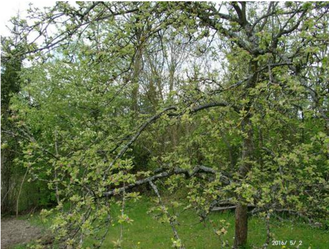
Bild 2: Das sind die Vegetationsstände Anfang Mai 2016: Der Apfelbaum ist am Aufblühen, der Birnbaum links hinter dem Apfelbaum blüht noch und die Ahornbäumchen zwischen beiden in der Hecke dahinter fangen erst an zu ergrünen. Der noch niemals gedüngte Grasbewuchs am Boden ist noch recht spärlich. Es handelt sich um einen frei stehenden Platz auf 456m Höhe.

Fazit: Die Kohlendioxidkonzentration der Atmosphäre ist seit 1955 von 0,03% auf 0,04% gestiegen, die Düngung hat zugenommen, das sind alles vegetationsfördernde Maßnahmen. Da die Apriltemperatur 2016 nach Abzug eines WI-effektes eher niedriger ist in der freien Fläche als damals, hat sich bei der Vegetation überhaupt nichts verändert.