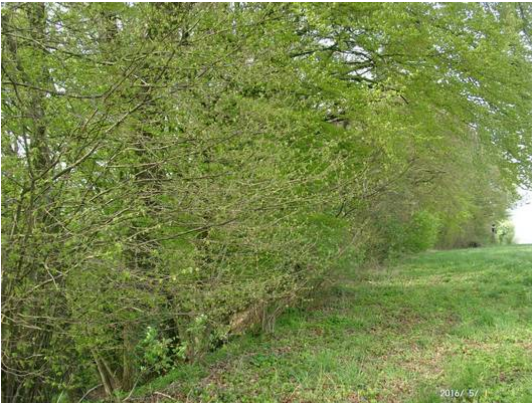
Bild 1: Aufnahme vom 1.Mai 2016, wegen des Schaltjahres eigentlich ein Tag mehr. Die Buchen, Hasel und Traubenkirschensträucher stehen 500 m außerhalb des Wohnortes des Fotografen in der freien Fläche, genauso wie vor 60/70 Jahren. Die Meereshöhe beträgt etwa 460 bis 465 m.