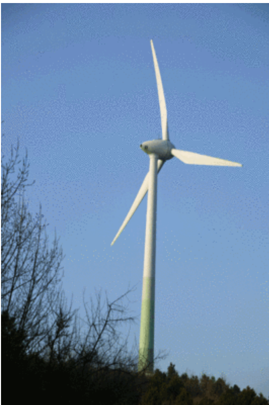
Bild 1. Die gesamte Stromversorgung der Inseln soll künftig durch Windenergieanlagen erfolgen

Das dort realisierte Projekt ist typisch für so viele Vorhaben, die von angeblich „grünbewegten“ Geschäftemachern mit reichlich zur Verfügung gestellten öffentlichen Geldern durchgezogen und von ihren Handlangern in den Medien über den grünen Klee gelobt werden. Es werden große Versprechungen gemacht, satte Förderungen eingestrichen und wunderschön anzusehende nagelneue Installationen in die Landschaft geklotzt. Der Film zeichnete die verschiedenen Stufen des Projektablaufs von der Konzeption über die einzelnen Realisierungsstufen nach und gab den Initiatoren reichlich Gelegenheit, sich und ihre Rolle bei dem Vorhaben effektiv in Szene zu setzen.