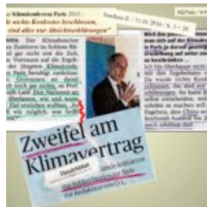
Fakten vs. Predigt; zum Vergrößern anklicken