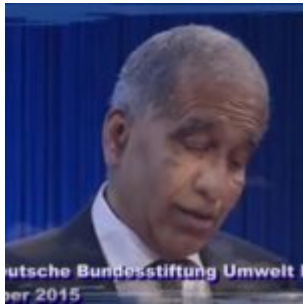
Prof. Dr. Mojib Latif, bei der Preisverleihung DBU

komme was da wolle, über den Glauben stellen müsste. Und die sehen im großen und Ganzen anders aus, als Herr Latif uns und seinen Zuschauern weismachen will.