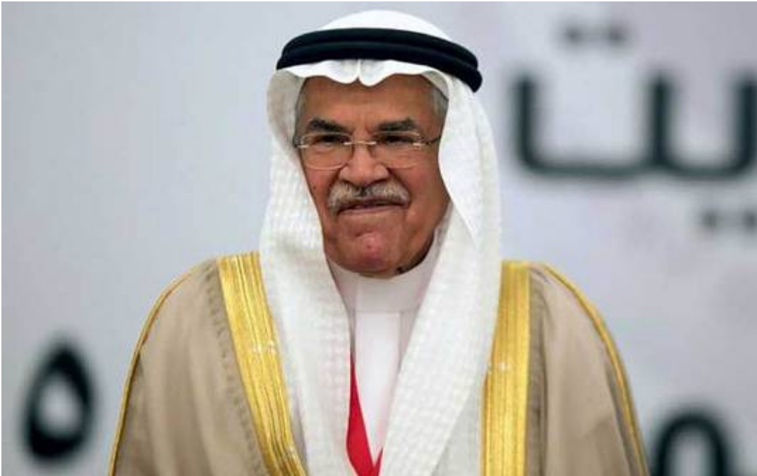
Saudi Arabiens Ölminister Ali al-Naimi

Trotzdem steigt die Nachfrage nach Öl rasch. Die Weltwirtschaft wird bis zum Jahr 2020 zusätzlich 7 Millionen Barrel pro Tag benötigen. Die natürliche Erschöpfung bestehender Felder impliziert einen Verlust von weiteren 13 Millionen Barrel pro Tag bis dahin.