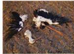
Bild: Abmessungen und von Windrädern verursachte Schäden an Landschaft und Natur [Buer].