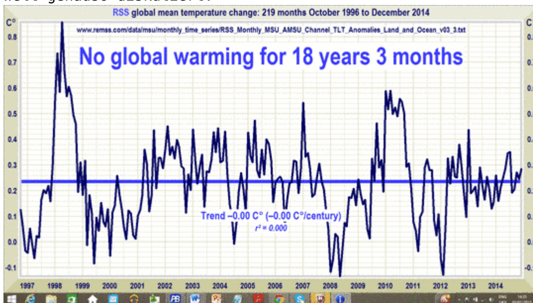
Abb. 4 Aktueller Stand der Entwicklung der globalen Mitteltemperatur nach Satellitenbeobachtungen ausgewertet durch RSS. Kein Anstieg seit 18 Jahren und 3 Monaten. Zur Erinnerung, das IPCC wurde 1988 also bereits 12 Jahre nach Beginn der Minierwärmung im vorigen Jhh gegründet. Diese

Gleich zu Beginn wies der darauf hin, dass er davon ausgehe, dass das CO 2 die Globaltemperatur gefährlich aufheize, das sei schließlich im Bericht der Arbeitsgruppe I so festgehalten worden (... Der 5. Sachstandsbericht des Weltklimarats IPCC zeigt, dass menschliche Aktivitäten für den Anstieg der globalen Mitteltemperatur verantwortlich sind: die Verbrennung von Kohle, Öl und Gas und Entwaldung.), leider seien weder er noch seine Kollegen in der Lage mitzuteilen ob und wann und wo diese gefährliche Erwärmung, leider auch nicht bis zu welcher Höhe sie eintreten würde, aber dass es irgendwie, irgendwann, irgendwo dazu käme sei höchst wahrscheinlich. Deswegen sei es so notwendig schon jetzt und weltweit die notwendigen Gegen-Maßnahmen zu treffen, von denen er einige aufzeigen wolle. Diese seien zwar die private Meinung des O. Edenhofer aber würden trotzdem mit vielen Verantwortlichen in dieser Welt genauso diskutiert.