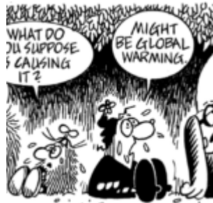
zum Vergrössern anklicken; Cartoon von Russel Myers