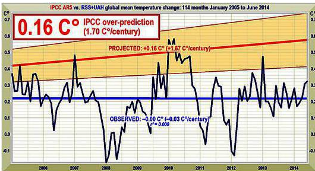
Abbildung 3: Vorhergesagte Temperaturänderung, Januar 2005 bis Juni 2014 mit einer Rate äquivalent zu 1,7^{\circ}\text{C} ( 1,0; 2,3^{\circ}\text{C} ) pro Jahrhundert (orange Fläche mit dicker roter Best Estimate-Trendlinie), verglichen mit den beobachteten Anomalien (dunkelblau) und dem Trend (hellblau).

Im Jahre 1990 lag die zentrale Schätzung hinsichtlich einer kurzfristigen Erwärmung um zwei Drittel höher als heute. Damals war es ein Äquivalent von 2,8^{\circ}\text{C} pro Jahrhundert. Jetzt ist es ein Äquivalent von 1,7^{\circ}\text{C} – und, wie Abbildung 3 zeigt, ist selbst das noch eine substantielle Übertreibung.