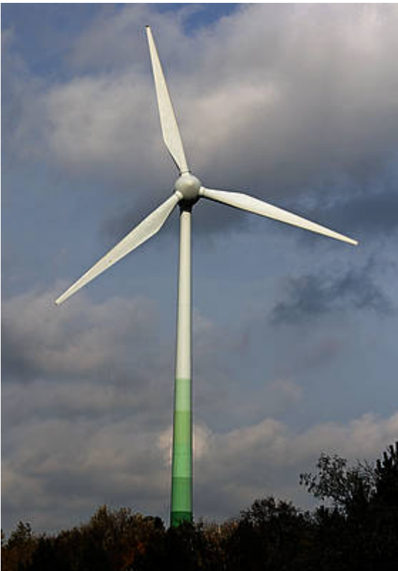
Bild 1. Bei ihren aktuellen Energiewende-Planungen setzt die neue Bundesregierung vor allem auf die Windenergie

Die Energiewende wird noch einmal beschleunigt [SPI1, SPI2]. Bis zum Jahr 2025 sollen 40-45 % Strom aus sogenannten „erneuerbaren“ Energien erzeugt werden, mit eindeutigem Schwerpunkt auf der Windenergie ( Bild 1 ), insbesondere an den küstennahen Standorten in Norddeutschland. Die Kapazität der Offshore-Windenergie soll von derzeit wenigen 100 MW auf 6500 MW vervielfacht werden. Dies dürfte vor allem zu Lasten der konventionellen Kraftwerke gehen, denen man – soweit sie fossil befeuert werden – zusätzlich auch noch die CO 2 -Zertifikate verteuern will [CO 2 ].